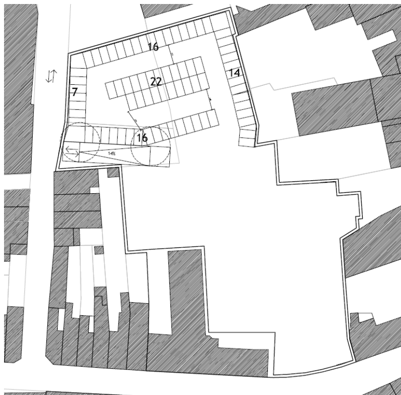
Figuur 2: Situering van de ondergrondse parking (Urban Platform cvba, 2018)

Naar aanleiding van een aanvraag voor een omgevingsvergunning voor stedenbouwkundige handelingen heeft ARCHEBO bvba een archeologienota opgemaakt voor de gebouwen van het Onze-Lieve-Vrouwecollege in Tienen en een deel van het voormalige klooster van de Augustijnen. Het projectgebied bevindt zich ten westen van de Grote Markt van Tienen, langs de Broekstraat, de Danebroekstraat en de Dr. J. Geensstraat. De toekomstplannen omvatten de afbraak van bestaande gehelen, een nieuwbouw en nieuwe ondergrondse constructies. Er komt een ondergrondse parking onder een deel van het projectgebied, de toegang wordt voorzien langs de Danebroekstraat. Het projectgebied is ca. 9490 m 2 groot.