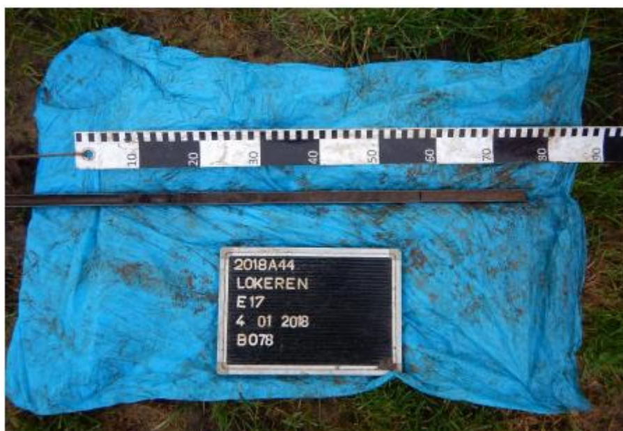
Figuur 1: Boorprofiel 78, bovenzijde links en onderzijde rechts

Een landschappelijk bodemonderzoek is niet schadelijk voor het bodemarchief binnen het plangebied.