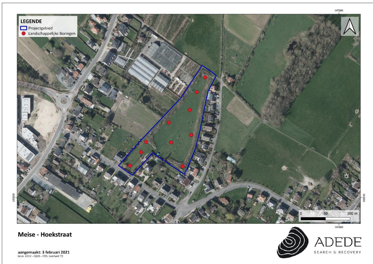
Figuur 1. Boorplan

In totaal werden 10 boorpunten uitgezet in een boorplan. De boorpunten zijn uitgezet volgens een verspringend grid van 20x30m: deze werden door de aard en de vorm van het plangebied los van het grid geplaatst met als doelstelling een volledig inzicht te krijgen over de bodemopbouw op het projectgebied.