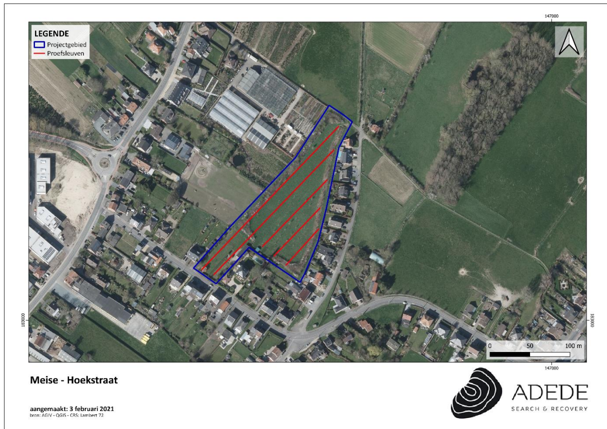
Figuur 2. Proefsleuvenplan