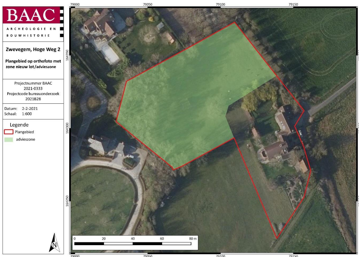
Plan 1: Plangebied met afbakening van de zone voor verder vooronderzoek (digitaal; 1:1; 02/02/2021)