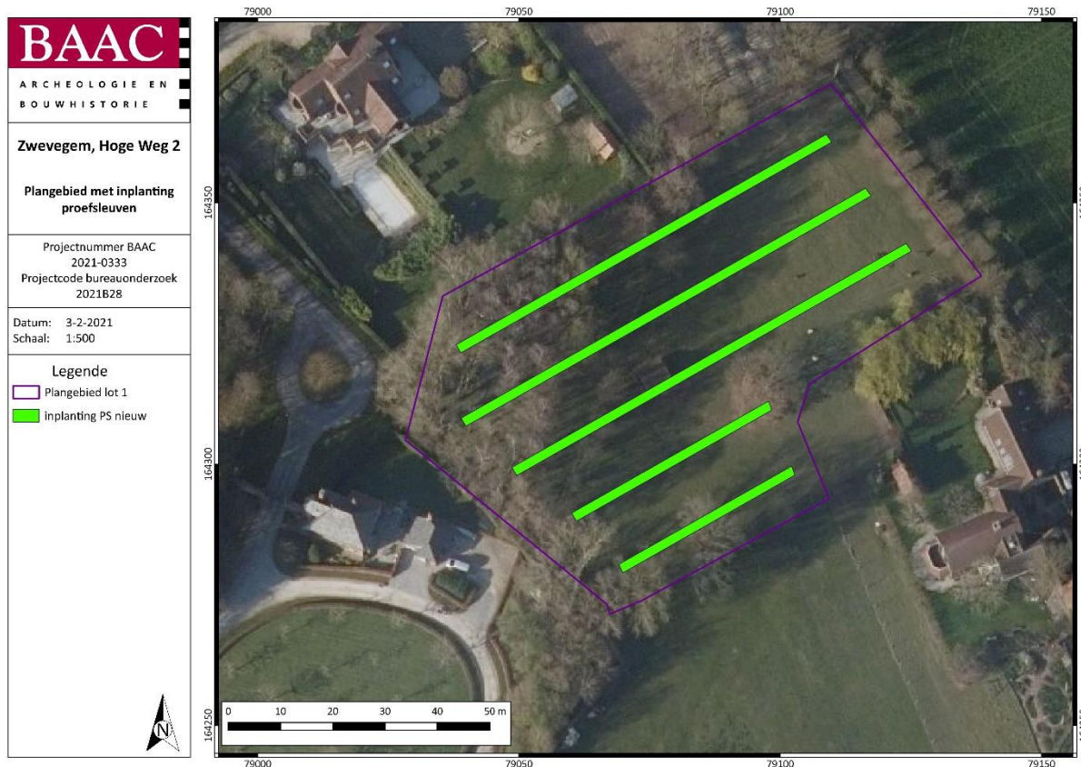
Plan 3: Inplanting proefsleuven (digitaal; 1:1; 03/02/2021).

for soil description en de Code van Goede Praktijk. De aangetroffen bodems worden gedetermineerd conform het Belgisch bodemclassificatiesysteem.