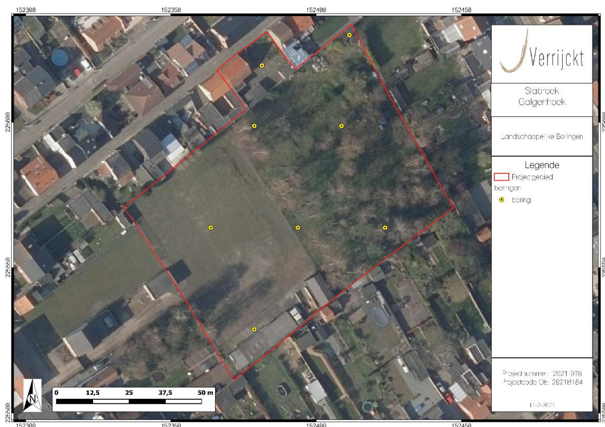
Figuur 2: Inplanting landschappelijke boringen

Binnen het plangebied worden de boringen geplaatst in een verspringend driehoeksgrid van 30 x 35 m. Concreet betekent dit dat er binnen het plangebied 8 boringen geplaatst worden. Mocht ter plaatse blijken dat deze vooropgestelde boorpunten onuitvoerbaar of ontoegankelijk zijn kan de veldwerkleider ter plaatse evalueren en herlokaliseren. Het verplaatste boorpunt wordt in dat geval opnieuw ingemeten en aangeduid op de kaart. Alle boringen dienen minimaal tot een diepte van 100 cm beneden het maaiveld geplaatst te worden.