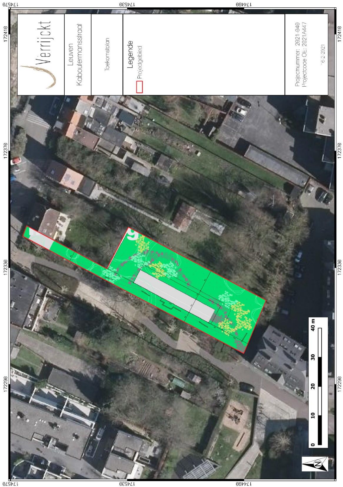
Figuur 1: Syntheseplan