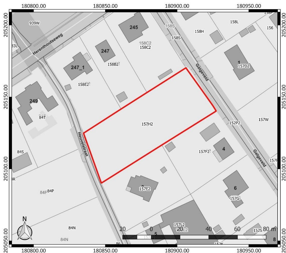
Figuur 1: Kadasterplan met aanduiding van het onderzoeksgebied in rood ( www.geopunt.be )