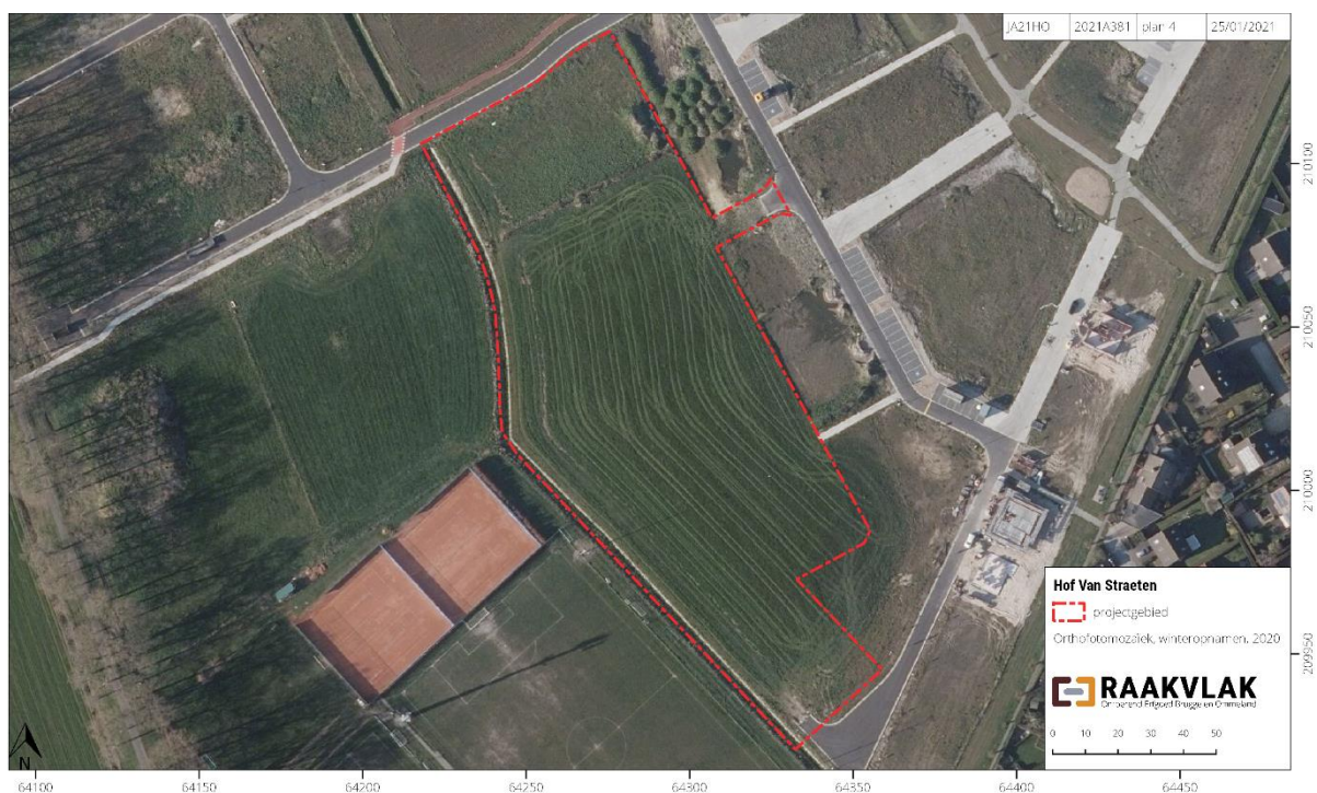
Figuur 1: Het projectgebied op de orthofoto uit 2020 (AGIV)

Vivendo plant de ontwikkeling van een verkaveling langs het Hof Van Straeten in Jabbeke. De oppervlakte van de geplande werken bedraagt 14.378 m 2 . Om de mogelijke aantasting van het bodemarchief op deze terreinen in te schatten werkt Vivendo samen met Aardewerk, de cel archeologisch onderzoek van Raakvlak. Doel van de opdracht is het waarderen van het terrein aan de hand van een bureauonderzoek en een proefsleuvenonderzoek. Dit onderzoek resulteert in een 'Nota archeologisch vooronderzoek met ingreep in de bodem'.