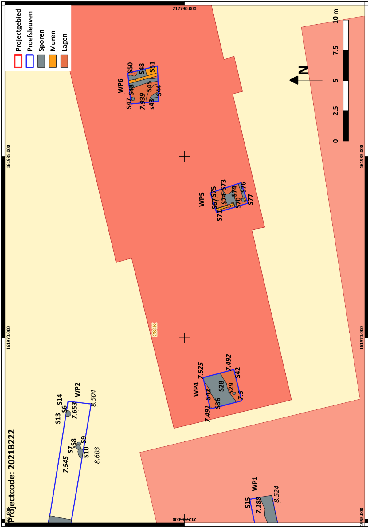
Figuur 3: Allesporenkaart Werkput 4 tem 6, vlak 1 (1/100)