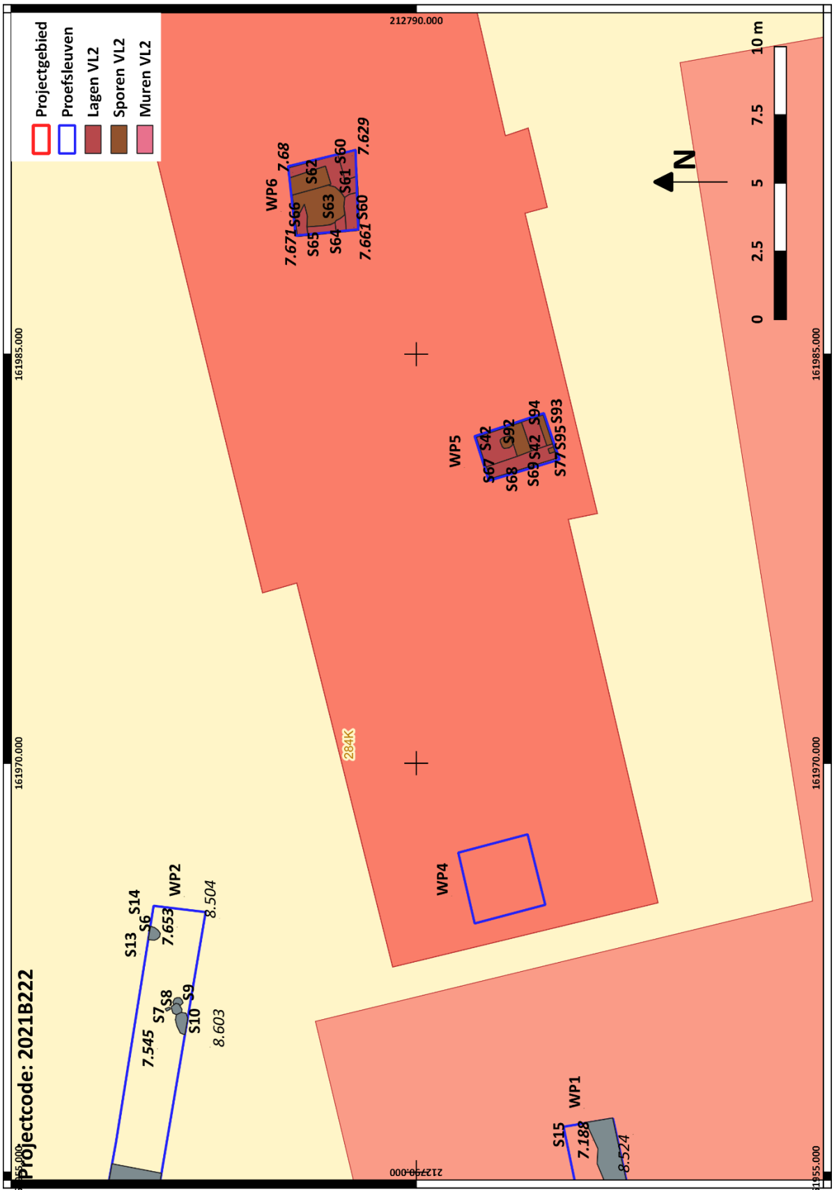
Figuur 4: Allesporenkaart Werkput 5 en 6, vlak 2 (1/100)