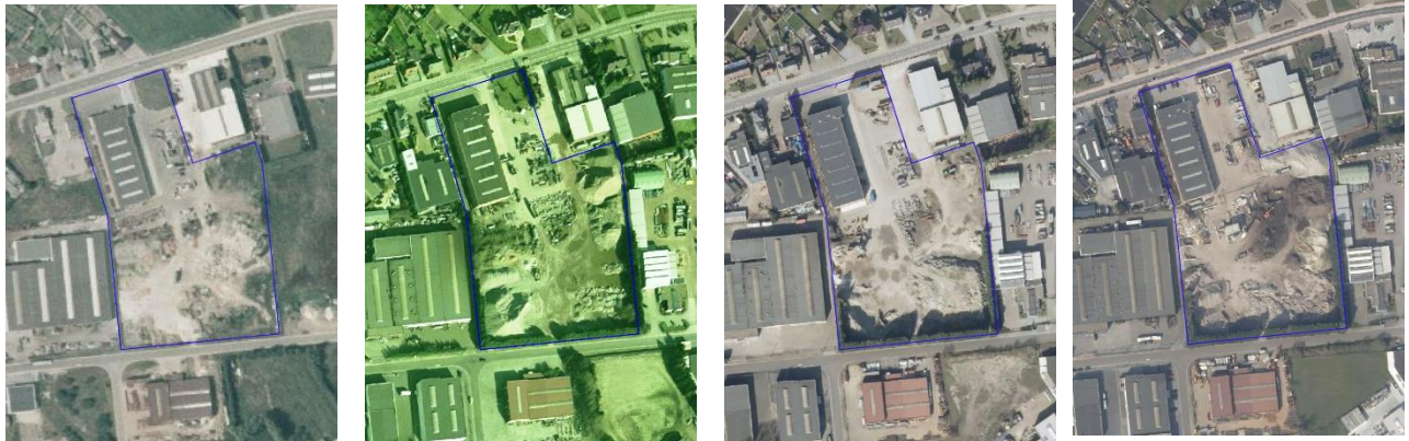
Fig. 18: evolutie van het terrein van 1988 - 2003 – 2014 - 2020

2: de toekomstige terreiningrepen zullen slechts in zeer beperkte mate verstoringen veroorzaken. Er wordt slechts over een oppervlakte van 2830 m 2 aan feitelijke bodemingrepen voorzien waarbij de grootste aaneensluitende oppervlakte 750 m 2 bedraagt, de betonvloer voor de betoncentrale. Die vloer wordt aangebracht op hetgeen nu al verhard is met steenslag, een echte bodemversturende ingreep is dus niet aan de orde. De andere bodemingrepen betreffen smalle funderingsgreppels voor de fundering van wanden voor granulaatbakken, een scherm rondom het zuidelijke deel van het projectgebied in betonblokken en een zone aan de zuidrand van 5 m breed achter de te plaatsen betonwand voor kappen en aanplant van een groenscherm. Aan de straatzijde wordt een bestaand talud geëgaliseerd, worden 3 bomen aangeplant en een kleine parking aangelegd.