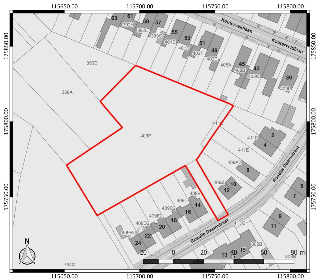
Figuur 1: Kadasterplan met aanduiding van het onderzoeksgebied in rood