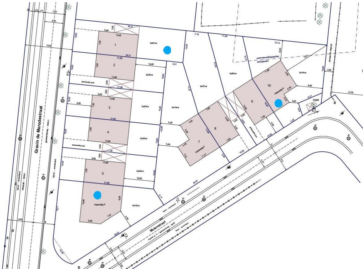
Figuur 3: Uitzettingsvoorstel boorpunten landschappelijk bodemonderzoek (© De Groot & Celen).