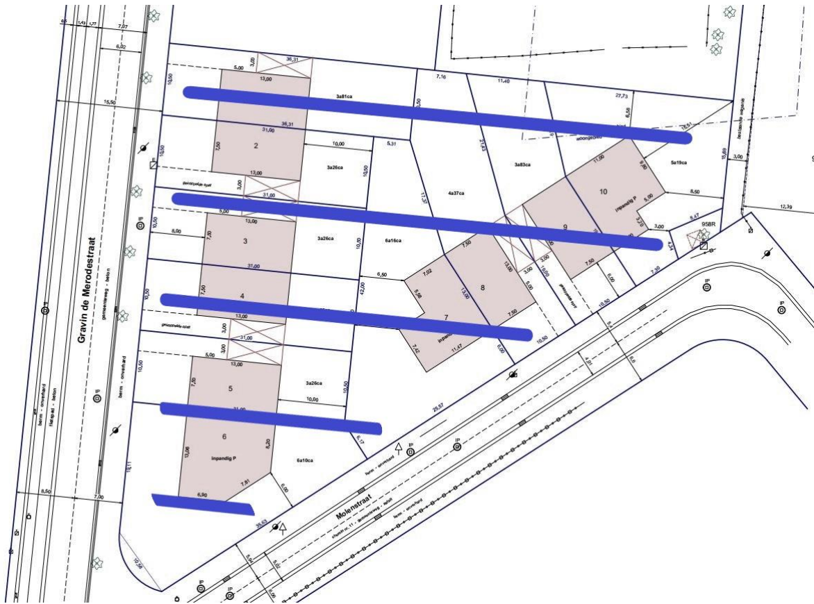
Figuur 4: Uitzettingsvoorstel proefsleuven.