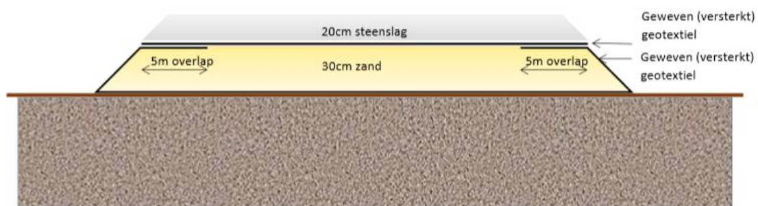
Figuur 1: Nieuwe plan van aanpak

Deze methoden zullen geen impact hebben op de onderliggende archeologisch erfgoed.