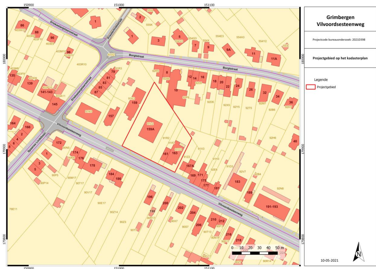
Figuur 1: Kadasterkaart met aanduiding projectgebied.