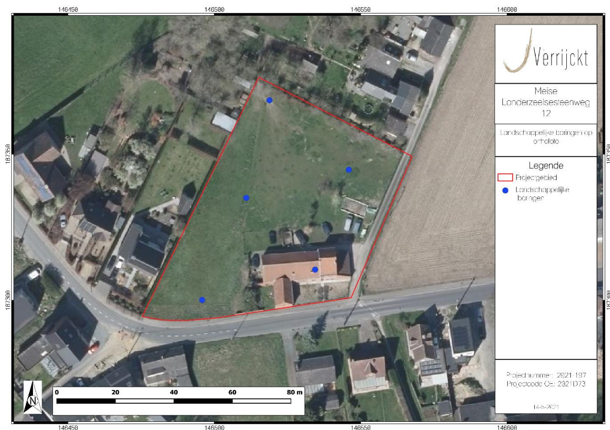
Figuur 2: Inplanting landschappelijke boringen

Binnen het plangebied worden de boringen geplaatst in een verspringend driehoeksgrid van 40 x 30 m. Concreet betekent dit dat er binnen het plangebied 5 boringen geplaatst worden. Mocht ter plaatse blijken dat deze vooropgestelde boorpunten onuitvoerbaar of ontoegankelijk zijn kan de veldwerkleider ter plaatse evalueren en herlokalisieren. Het verplaatste boorpunt wordt in dat geval opnieuw ingemeten en aangeduid op de kaart. Alle boringen dienen minimaal tot een diepte van 100 cm beneden het maaiveld geplaatst te worden.