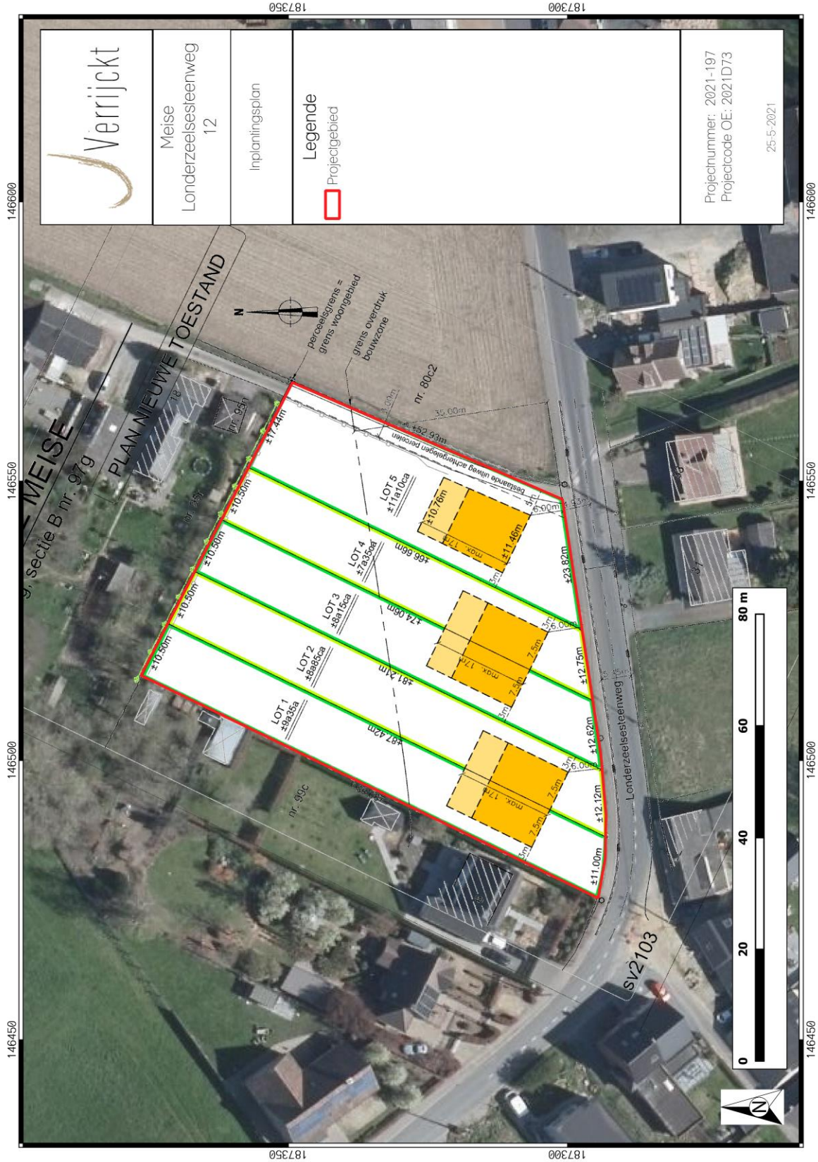
Figuur 1: Toekomstplan