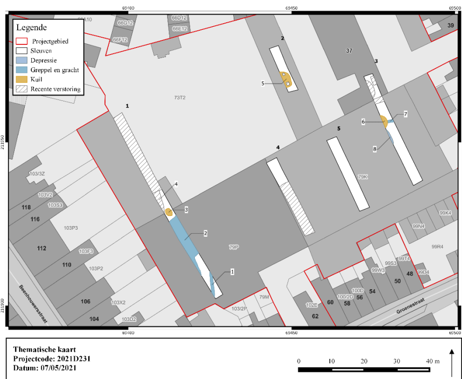
Figuur 2: Thematische kaart.

Op basis van de bekomen resultaten van het vooronderzoek met ingreep in de bodem uitgevoerd te Brugge Rozendal is duidelijk dat een vervolgonderzoek niet aangewezen is. Het aangetroffen archeologisch ensemble is te beperkt om de aanwezigheid van een archeologische site aan te tonen.