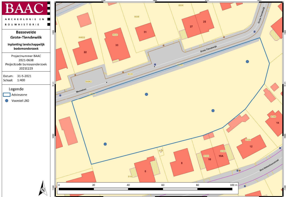
Plan 2: Inplantingsplan landschappelijke boringen (digitaal; 1:1; 30.05.2021)