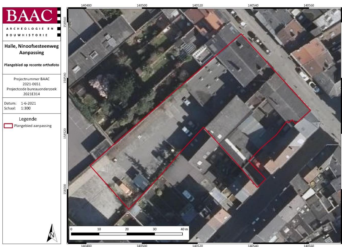
Plan 1: Plangebied met afbakening van de zone voor verder vooronderzoek (digitaal; 1:1; 01/06/2021)

Aangezien de geplande bodemingrepen over het gehele terrein plaatsvinden, wordt het volledig plangebied opgenomen als advieszone voor verder vooronderzoek.