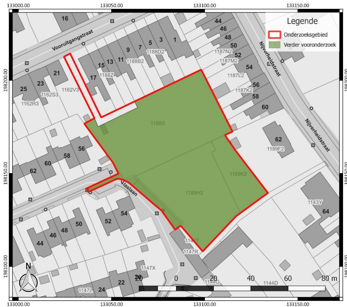
Figuur 2: Zone afgebakend voor verder vooronderzoek, weergegeven op het GRB ( www.geopunt.be )

De onderzoeksdoelen zijn succesvol bereikt wanneer de vooropgestelde onderzoeksvragen en de bijkomende onderzoeksvragen die opgesteld worden naar aanleiding van elk assessment beantwoord zijn.