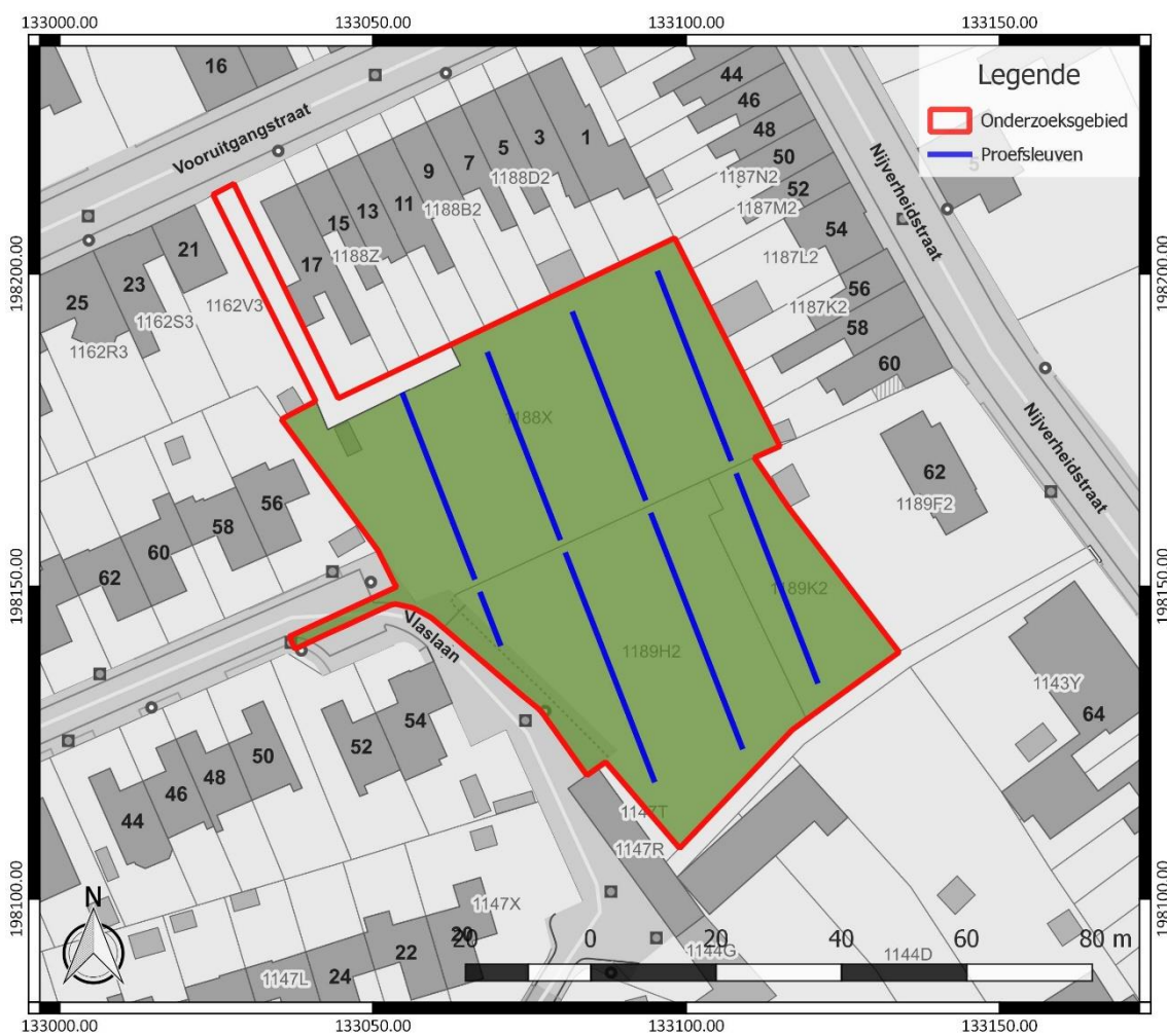
Figuur 3: Inplanting van de proefsleuven (blauw), binnen het onderzoeksgebied (rood), weergegeven op het GRB ( www.geopunt.be )

De proefsleuven hebben een maximale tussenafstand van middelpunt tot middelpunt van 15 m. De beoogde oppervlakte die onderzocht dient te worden door middel van proefsleuven, bedraagt minimaal 10 %. Dit wordt behaald aan de hand van het vooropgestelde sleuvenplan, dat voorziet in 248 lopende m proefsleuven.