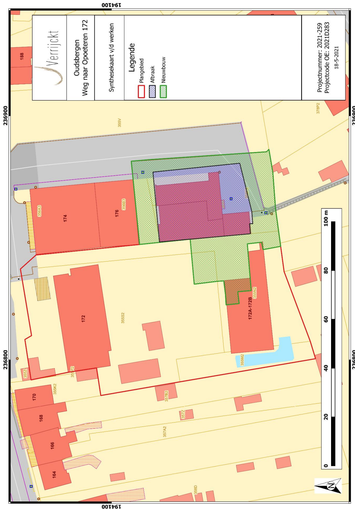
Figuur 1: Toekomstplan