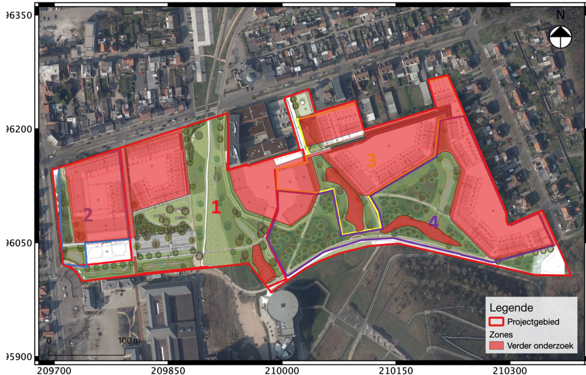
Fig. 3.7: Synthesepan van de zone die geselecteerd is voor verder vooronderzoek met ingreep in de bodem (rood).

Op basis van bovenstaande afwegingen wordt een vervolgonderzoek in uitgesteld traject voorgesteld dat bestaat uit proefsleuven over een deel van het projectgebied met een totale oppervlakte van 53.637m 2 (rood op fig. 3.7).