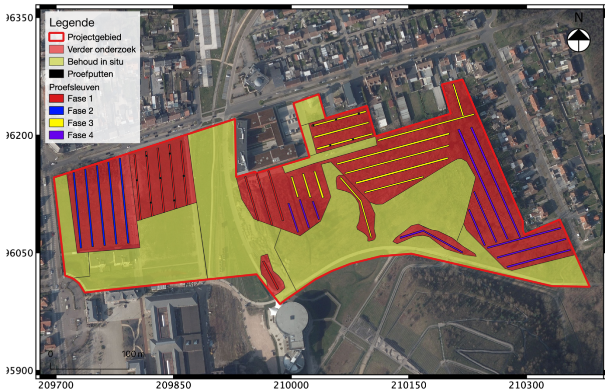
Fig. 3.9: Synthesepan met aanduiding van de voorgestelde proefsleuven.