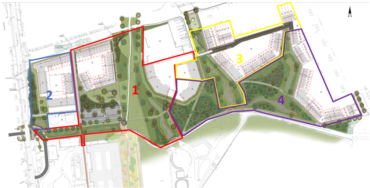
Fig. 3.6: Faseringsplan