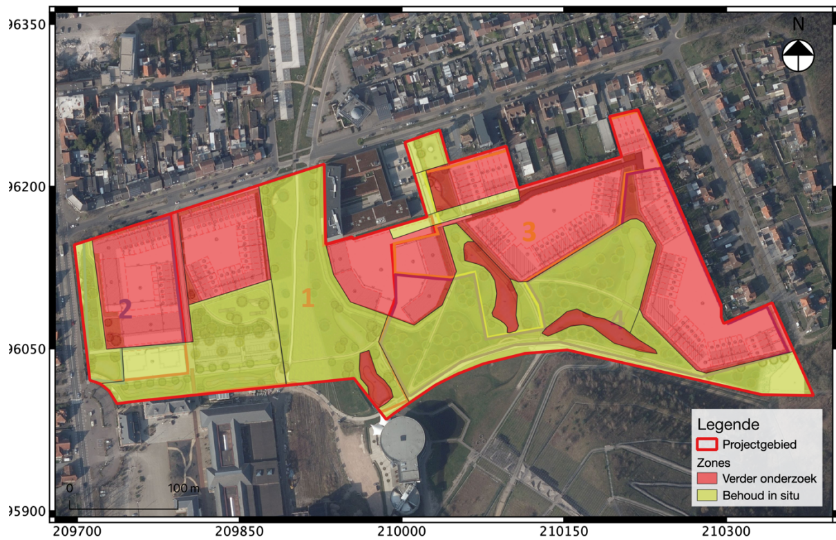
Fig. 3.4: Synthesekaart met zone voor verder onderzoek en behoud in situ met aanduiding van het projectgebied.