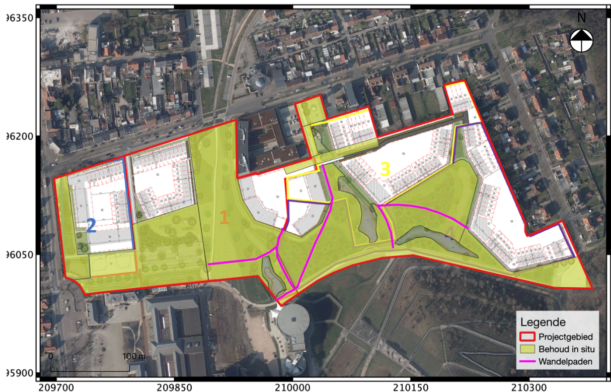
Fig. 3.5: Synthesepan van de zone die geselecteerd is voor behoud in situ met aanduiding van de aan te leggen wandelpaden.