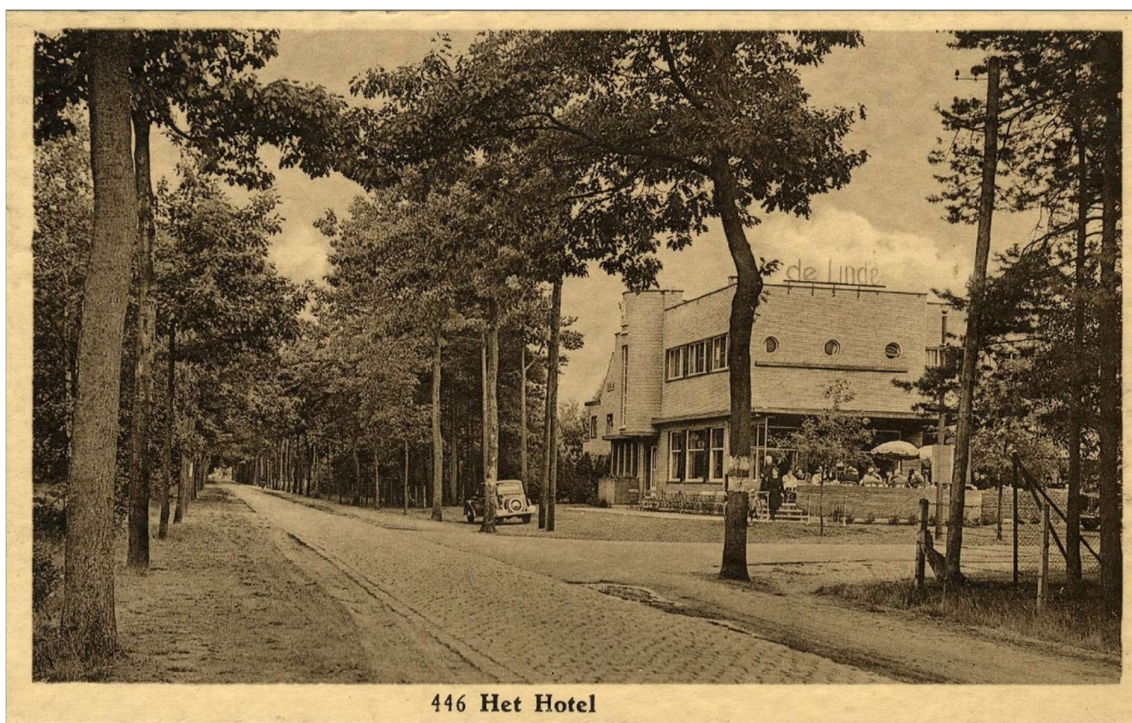
446 Het Hotel