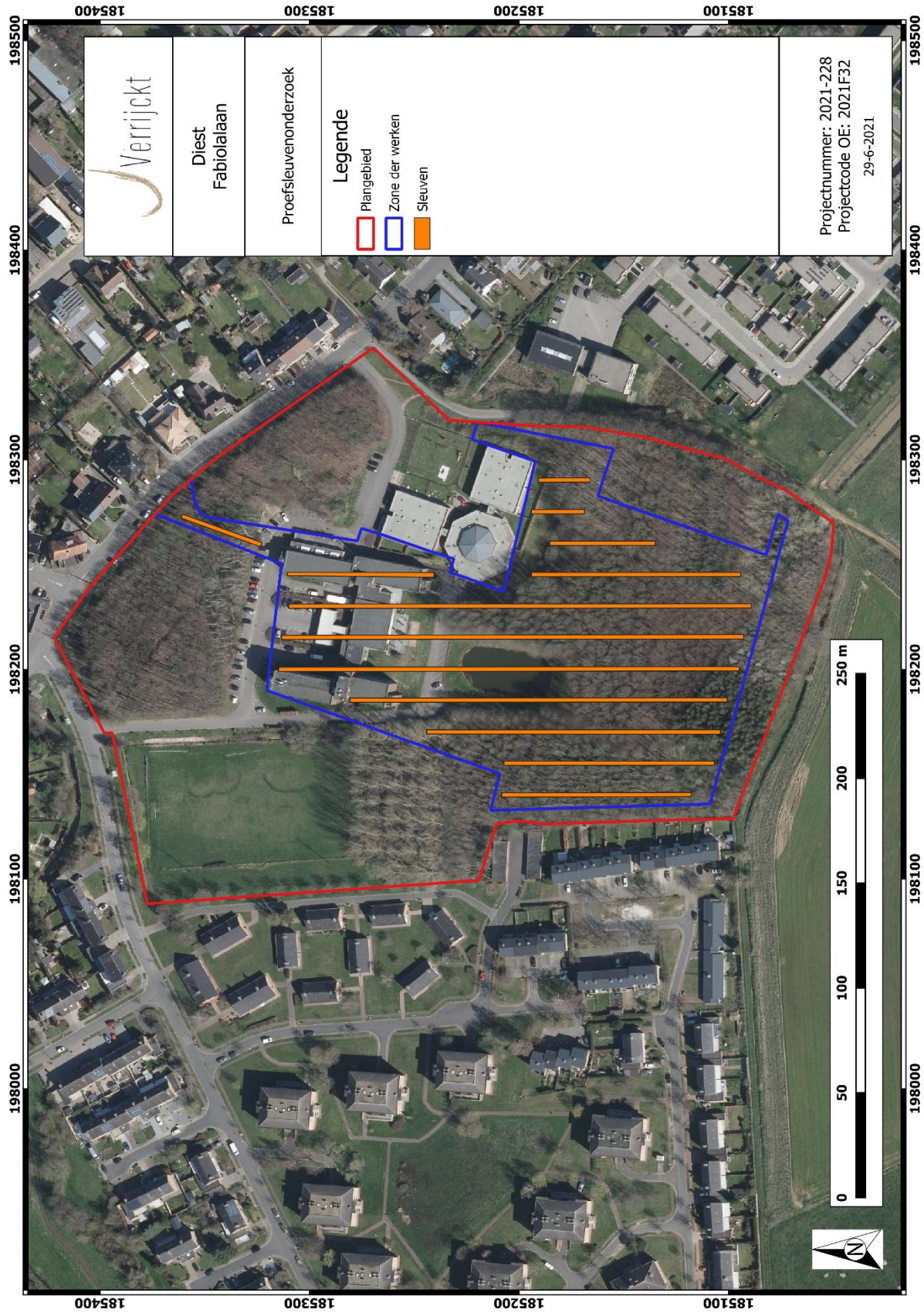
Figuur 4: Sleuvenplan