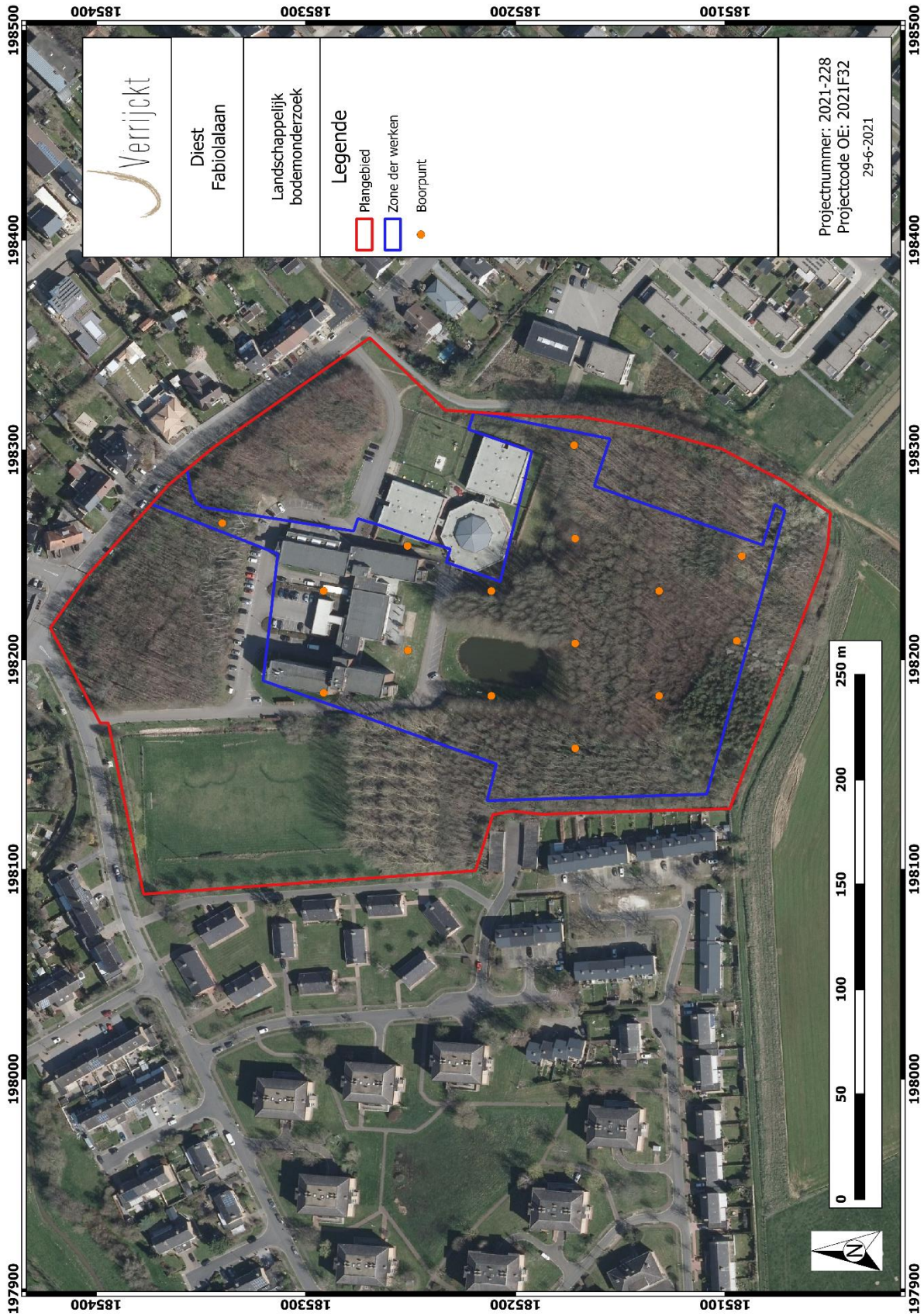
Figuur 3: Inplanting landschappelijke boringen