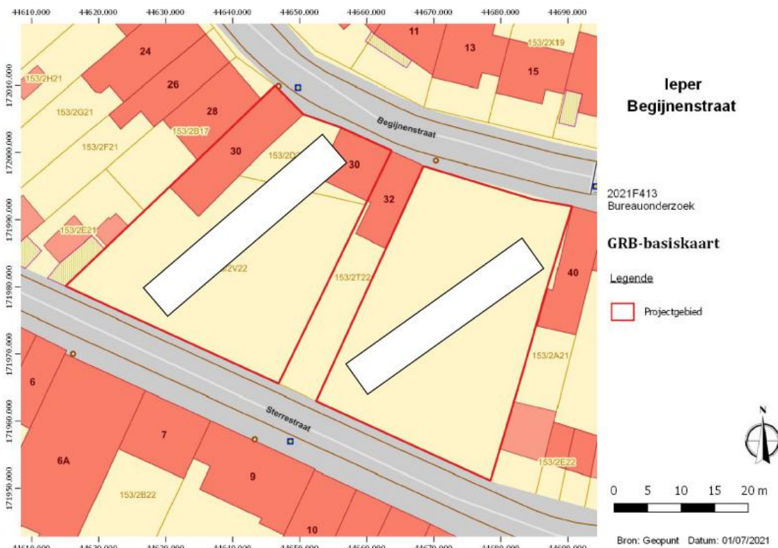
Figuur 1 GRB-basiskaart met locatie van de proefsleuven.

Indien met uitzondering van de verschillende fasen van de stadsversterking en gracht(en) geen andere relevante archeologische sporen aan het licht komen tijdens de prospectie, kan het archeologisch traject beperkt blijven tot de fase van de prospectie. Het vlakdekkend opgraven van een(vestigings/stads)gracht en versterkingen biedt weinig tot geen meerwaarde. De lokalisatie, opbouw en bewaringstoestand van de versterkingen kunnen onderzocht worden tijdens de fase van de prospectie. Dit geldt tevens voor de grachten: inzicht in dergelijke structuren wordt verkregen d.m.v. een doorgedreven stratigrafisch onderzoek.