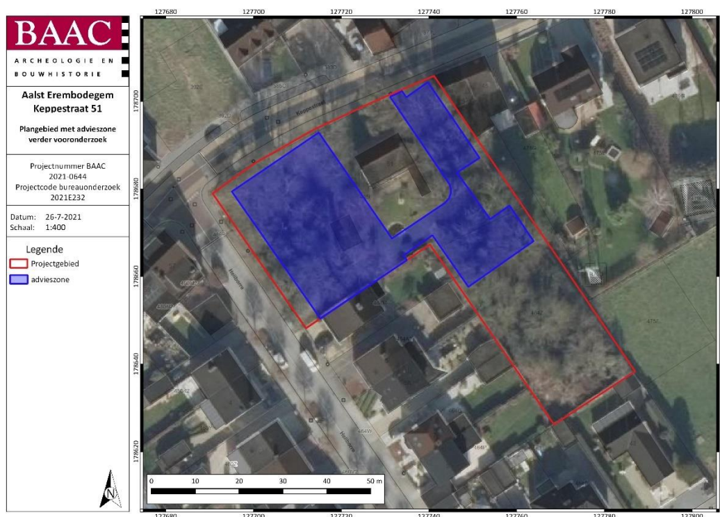
Plan 1: Plangebied met advieszone voor verder vooronderzoek (digitaal; 1:1; 26.07.2021)

Het verdere vooronderzoek beperkt zich tot de zones van de ingrepen. De advieszone voor verder onderzoek (1.385 m 2 ) wordt op onderstaand plan weergegeven.