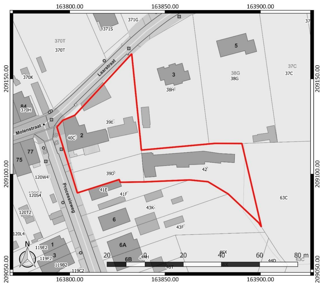
Figuur 1: Kadasterplan met aanduiding van het onderzoeksgebied in rood ( www.geopunt.be )