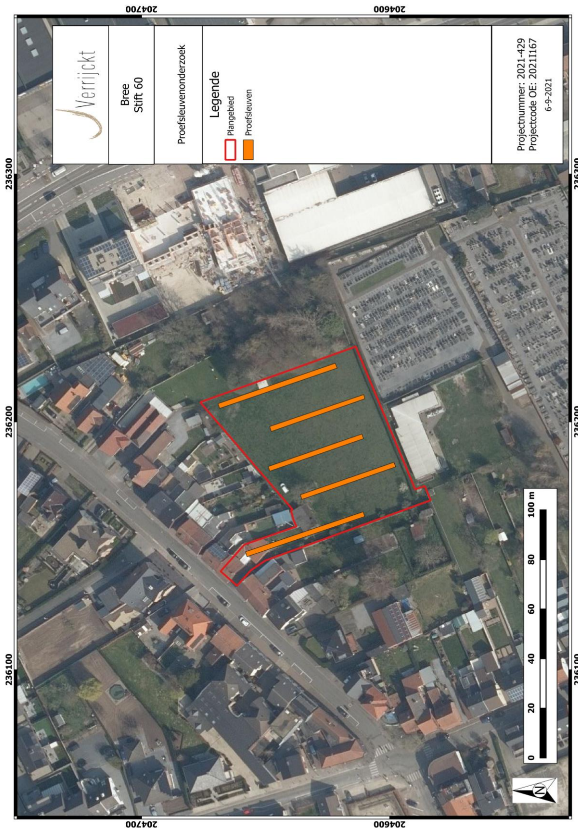
Figuur 3: Sleuvenplan