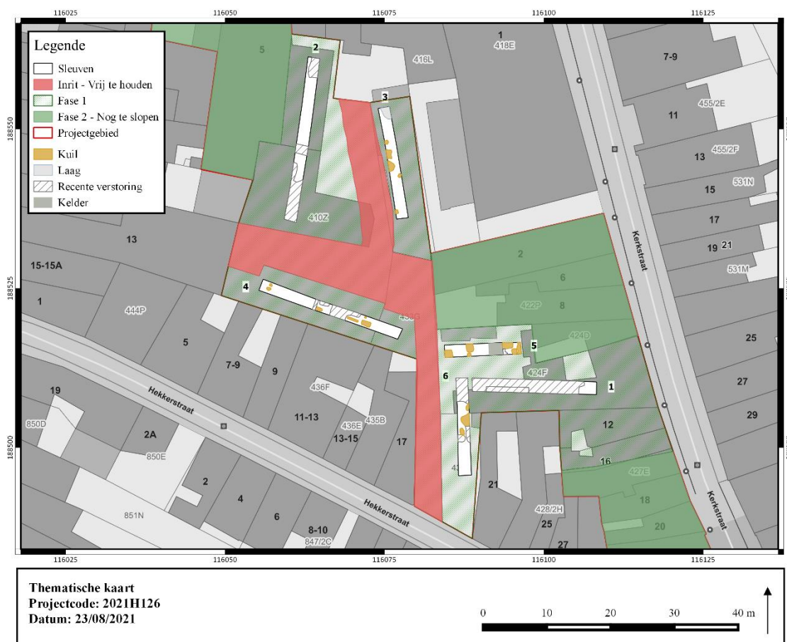
Figuur 2: Thematische kaart.