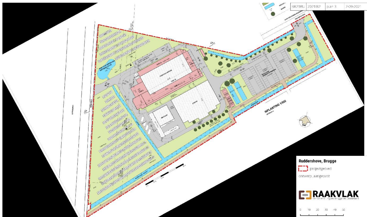
Figuur 1: Het ontwerpplan ten opzichte van de GRB-basiskaart

Mintus (OCMW Brugge) plant de verbouwing en uitbreiding van de centrale keuken Rudderstove langs de Oude Oostendse Steenweg in Brugge. De oppervlakte van het projectgebied bedraagt 1903,73 m 2 en van de geplande werken bedraagt de oppervlakte 31669,102 m 2 . Om de mogelijke aantasting van het bodemarchief op deze terreinen in te schatten werkt Mintus samen met Raakvlak. Doel van de opdracht is het waarderen van het terrein aan de hand van een bureauonderzoek. Dit onderzoek resulteert in een archeologienota.