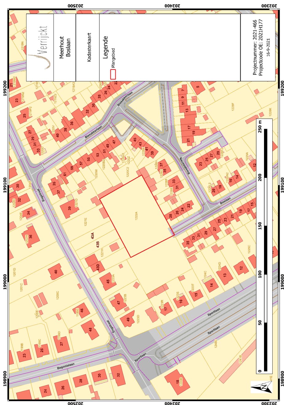
Figuur 1: Plangebied op de kadasterkaart 1

In totaal dient 3.510 m 2 door middel van proefsleuven onderzocht te worden.