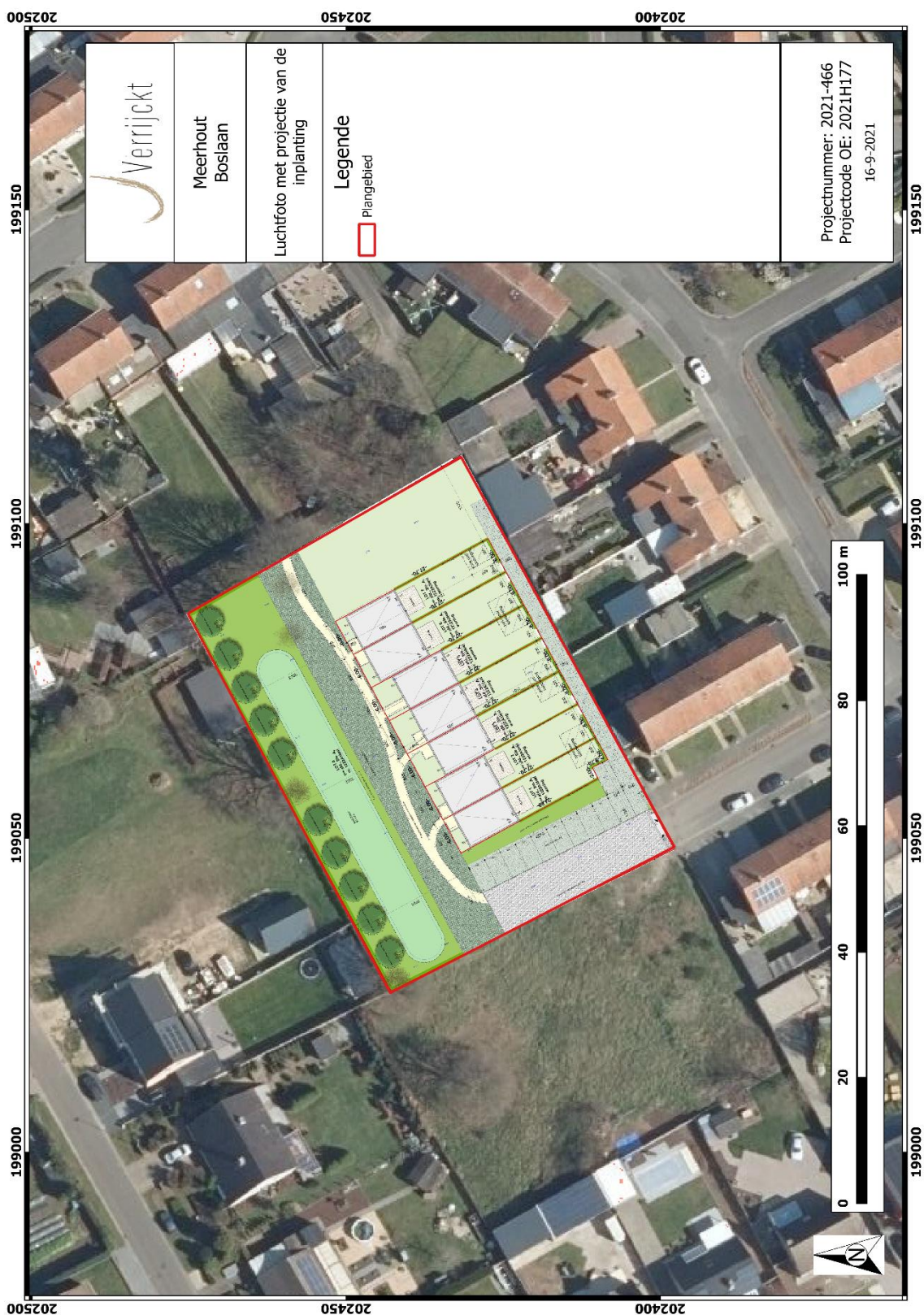
Figuur 2: Plangebied met weergave van toekomstige inplanting 2 op orthofoto 3