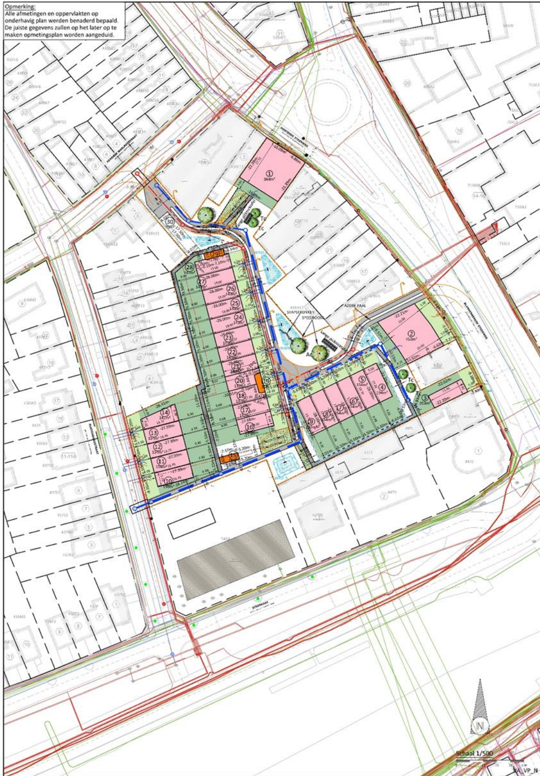
Figuur 1: Nieuw verkavelingsplan.

Opmerking: Alle afmetingen en oppervlakten op onderhavig plan werden benaderd bepaald. De juiste gegevens zullen op het later op te maken opmetingsplan worden aangeduid.