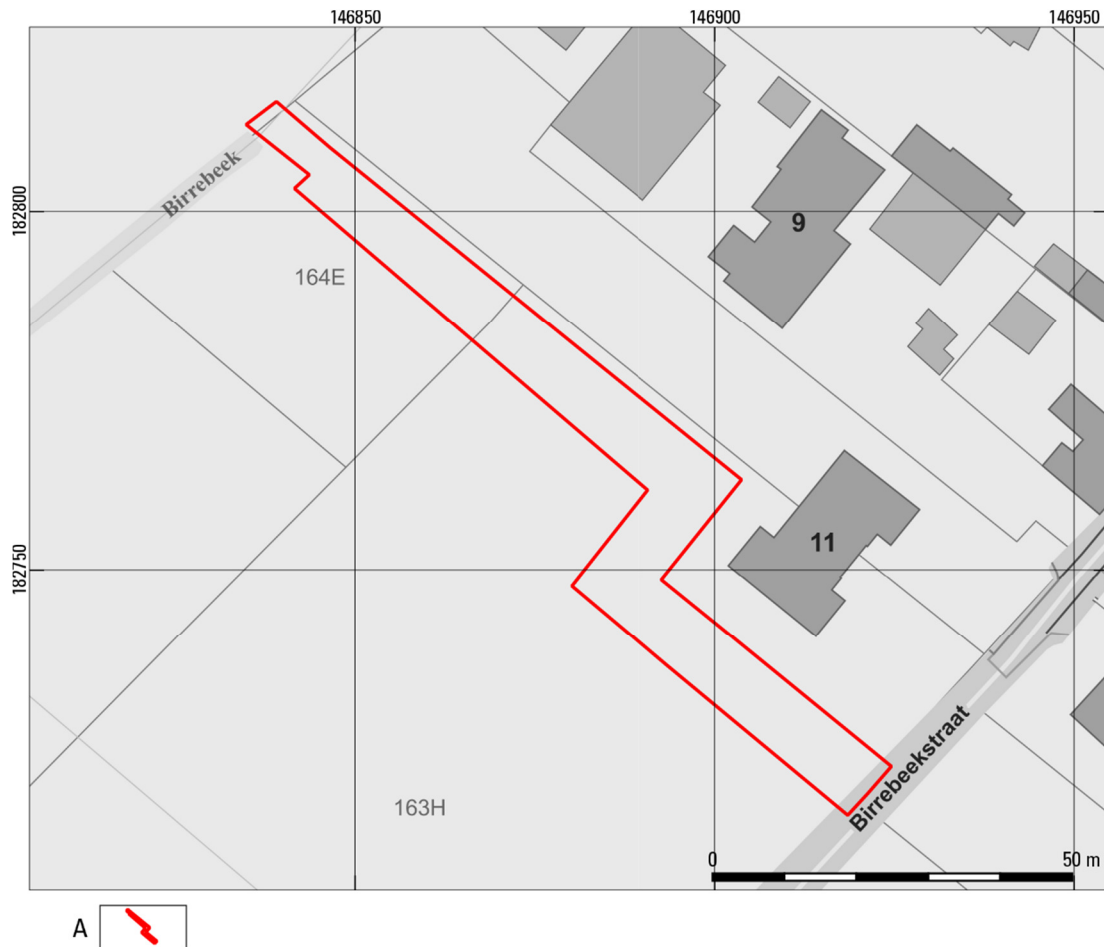
Fig. 2. Meise-Collector Sint-Brixius-Rode fase 2 (22.243). Locatie van deelgebied 2, onderwerp van de huidige nota, in het Groot Referentie Bestand (GRB). A onderzoeksgebied.