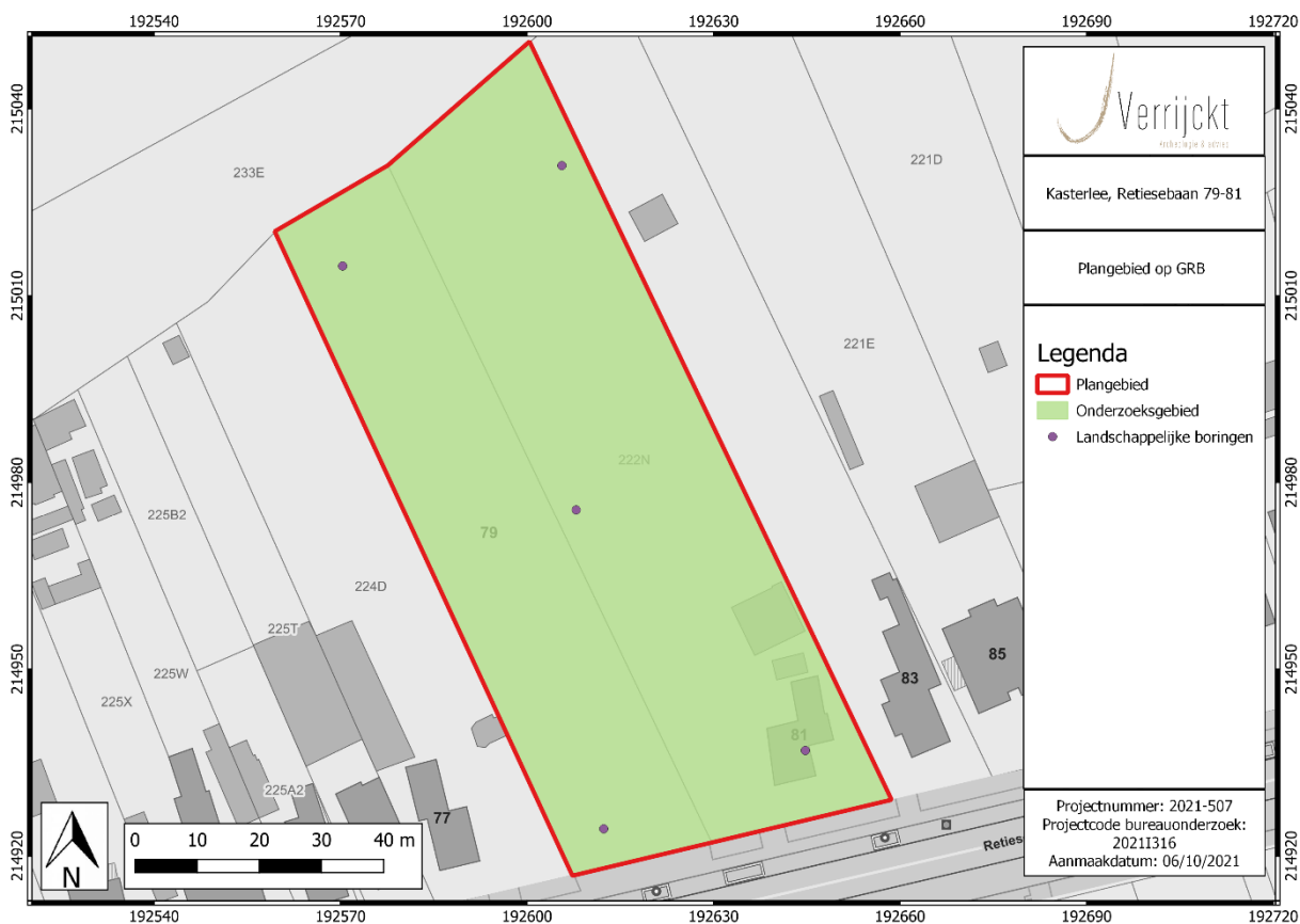
Figuur 3: Inplanting landschappelijke boringen

Binnen het plangebied worden de boringen geplaatst in een verspringend driehoeksgrid van 50 x 40 m. Concreet betekent dit dat er binnen het plangebied 5 boringen geplaatst worden. Mocht ter plaatse blijken dat deze vooropgestelde boorpunten onuitvoerbaar of ontoegankelijk zijn kan de veldwerkleider ter plaatse evalueren en herlokaliseren. Het verplaatste boorpunt wordt in dat geval opnieuw ingemeten en aangeduid op de kaart.