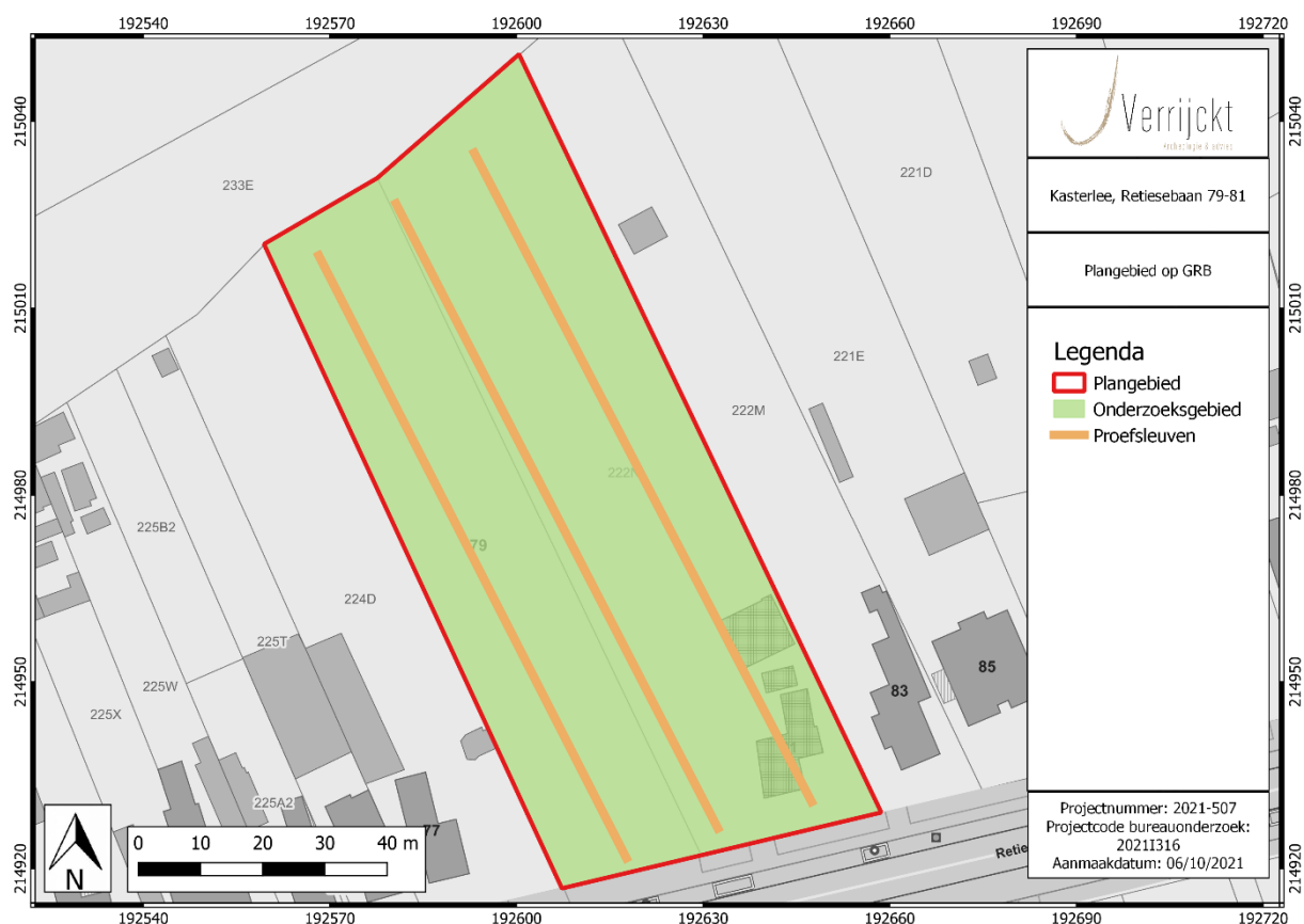
Figuur 4: Voorstel inplanting proefsleuven

Het onderzoek is succesvol wanneer een gefundeerde uitspraak kan worden gedaan over de aanwezigheid, de aard en omvang van een archeologische site.