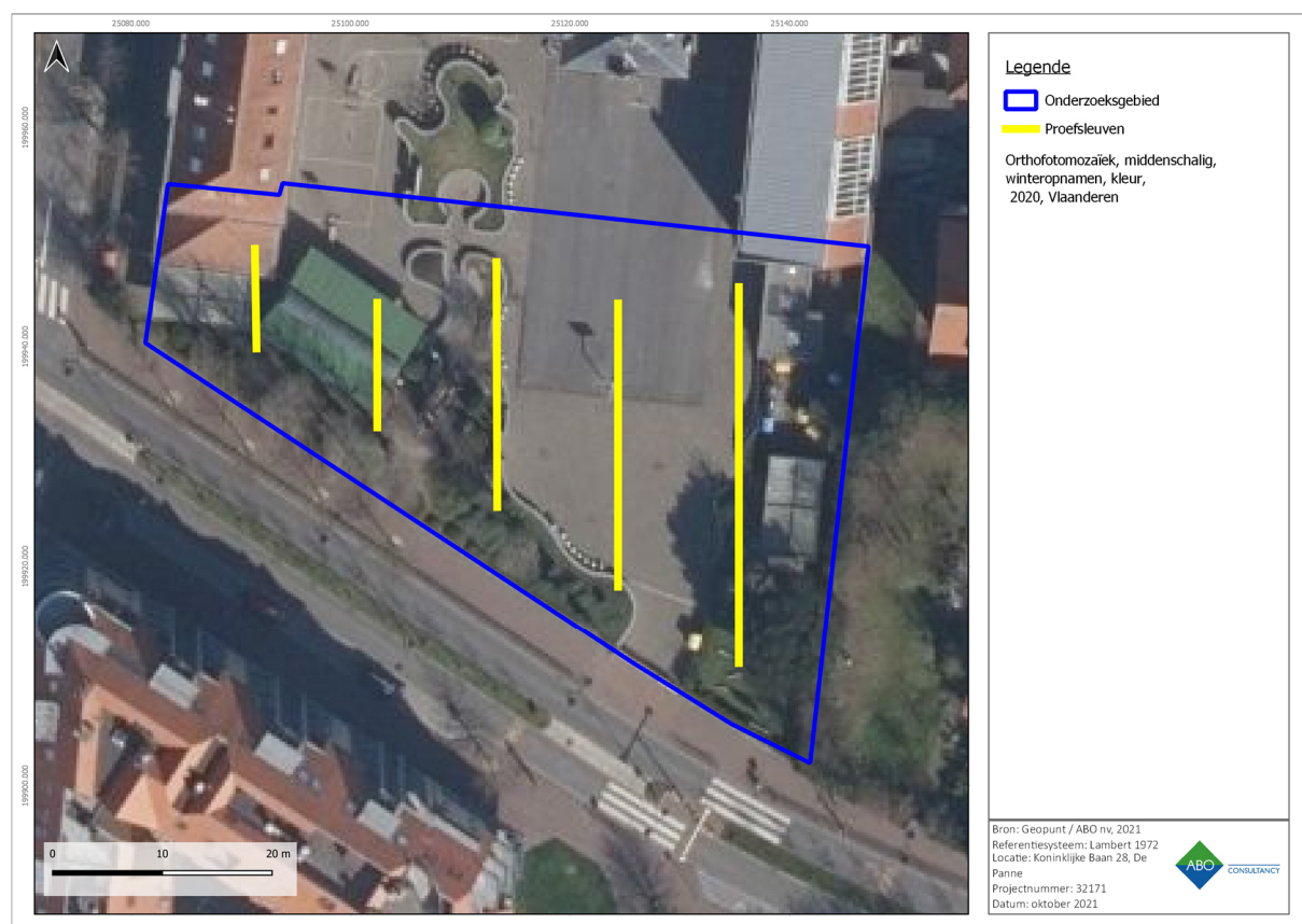
Figuur 42: Luchtfoto met het indicatief sleuvenplan.

Voor de aanleg van de proefsleuven wordt een graafmachine ingezet met een platte graafbak zonder tanden (CGP 8.6.2/3). In regel wordt één vlak aangelegd dat wordt onderzocht zoals beschreven in CGP 6.8.1.1. tot en met 8.6.1.9. De diepte van aanleg wordt tijdens de aanleg continu bijgestuurd op basis van minimaal twee putwandprofielen per sleuf, die bij voorkeur elke 50 meter geschrinkt geplaatst worden. Op basis van de putwanden wordt gekeken of zich dieperliggende niveaus met archeologische sporen en/of vondsten kunnen voordoen. In het voorkomende geval wordt op dit dieperliggend niveau lokaal een opgravingsvlak aangelegd en wordt dit ook onderzocht zoals beschreven in CGP 6.8.1.1. tot en met 8.6.1.9.