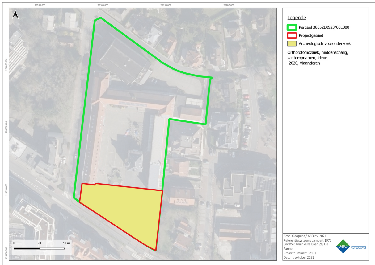
Figuur 40: Meest recente luchtfoto met aanduiding van het projectgebied en de geselecteerde zones voor verder onderzoek en vrijgave.

Omdat de geplande werkzaamheden het eventueel aanwezige archeologisch bodemarchief bedreigen, wordt bijkomend archeologisch onderzoek geadviseerd voor het hele projectgebied.