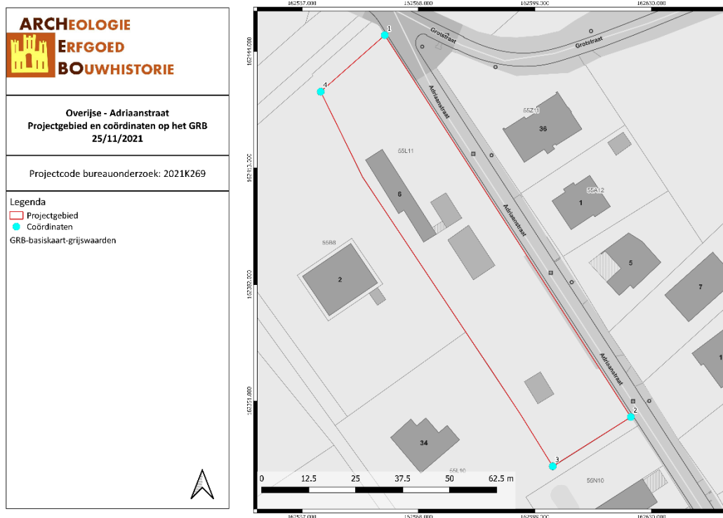
Figuur 1: Situering van het projectgebied op het GRB (Geopunt, 2021)