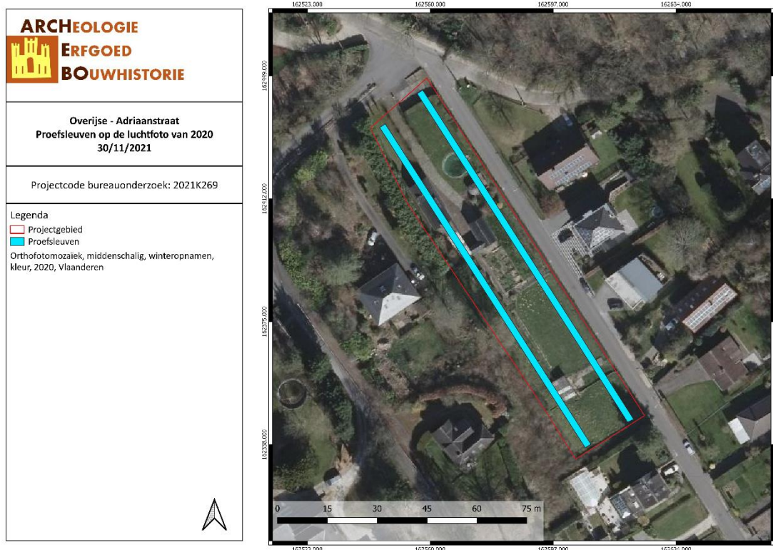
Figuur 4: Locatie proefsleuven op het onderzoeksterrein (ARCHEBO bvba, 2021)

Het onderzoeksdoel is bereikt wanneer op basis van het vooronderzoek met ingreep in de bodem een voldoende gefundeerde uitspraak kan worden gedaan over de aard, omvang en behoudenswaardigheid van de archeologische waarden in het plangebied en wanneer een eenduidig advies kan worden gegeven voor vrijgave van het terrein, een opgraving of behoud in situ. Om te bepalen of het onderzoeksdoel is bereikt, gebruikt de erkende archeoloog de volgende criteria: