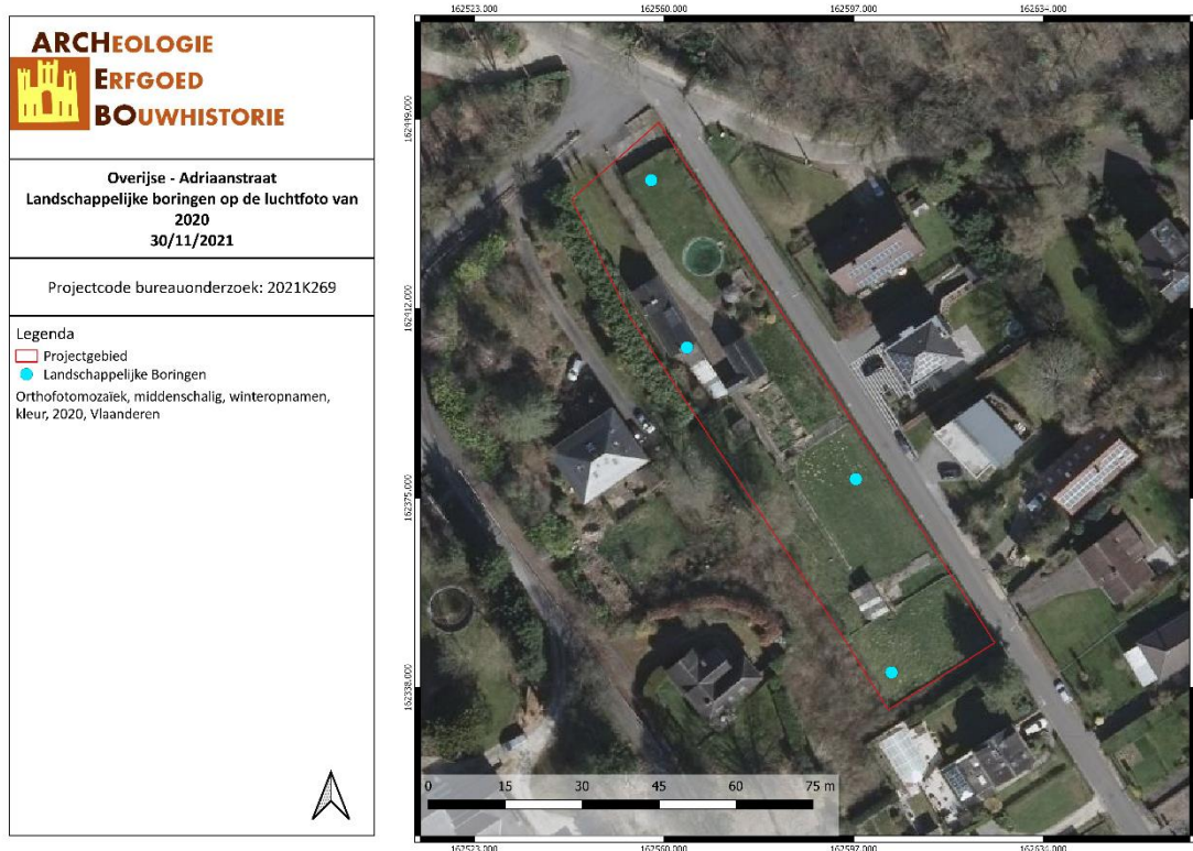
Figuur 3: Locatie boorpunten op het onderzoeksterrein (ARCHEBO bvba, 2021)

Het booronderzoek wordt uitgevoerd met een edelmanboor met een kop van 7cm. De boringen worden verspreid over het terrein geplaatst, met een voldoende aantal om de bodemkundige situatie te begrijpen (een minimum van 10 boringen per hectare). Tijdens dit onderzoek staat het vrij aan de bodemkundige om meer boringen te plaatsen indien dit nodig is voor een goed begrip van de bodemopbouw. De boringen worden zo geplaatst dat er in elk van de 3 gekarteerde bodemtypes een boring gezet wordt, met een vierde boring ter hoogte van de woning om de eventuele verstoringsgraad te bepalen.