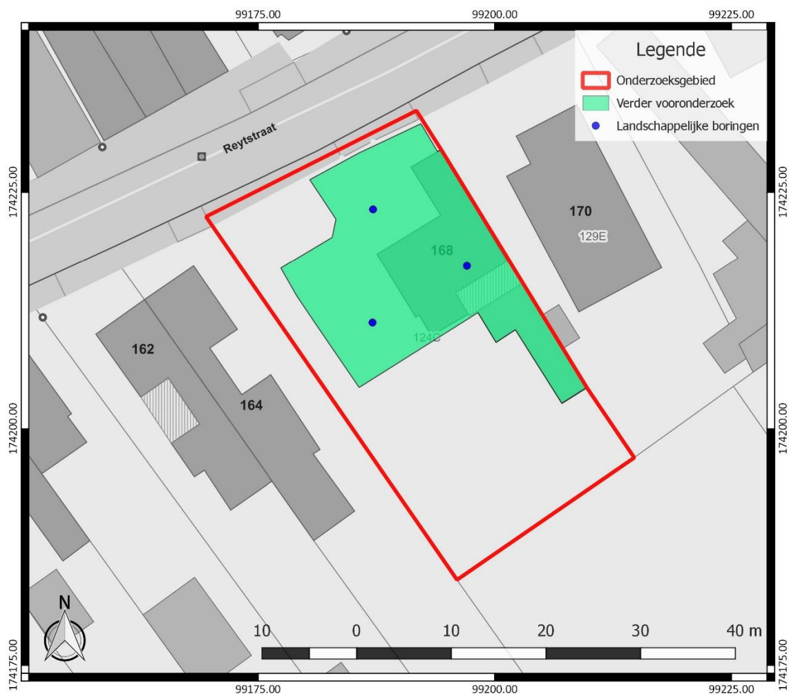
Figuur 3: Inplanting van de landschappelijke boringen (blauw), binnen het onderzoeksgebied (rood), weergegeven op het GRB ( www.geopunt.be )

Bijkomend booronderzoek in functie van steentijd artefactensites is nodig in de zones waar een goed bewaarde paleobodem of een actieve Holocene bodem die niet noodzakelijk moet afgedekt zijn, met potentieel op een steentijd artefactensite geregistreerd wordt. Een paleobodem kan zowel een Holocene bodem als een pre-Holocene bodem omvatten. Ter hoogte van het onderzoeksgebied is er voornamelijk een verwachting naar de aanwezigheid van een podzolbodem. Deze bestaat uit een opeenvolging van een A-, een E- en een B-horizont. Indien enkel de restanten van een goed bewaarde B-horizont aangetroffen worden, is er reeds sprake van een voldoende intacte bodem om de aanwezigheid van steentijd artefactensites mogelijk te maken. Indien geen goed bewaarde bodem met potentieel op een steentijd artefactensite geregistreerd is op het terrein, kan meteen overgegaan worden tot een proefsleuvenonderzoek.