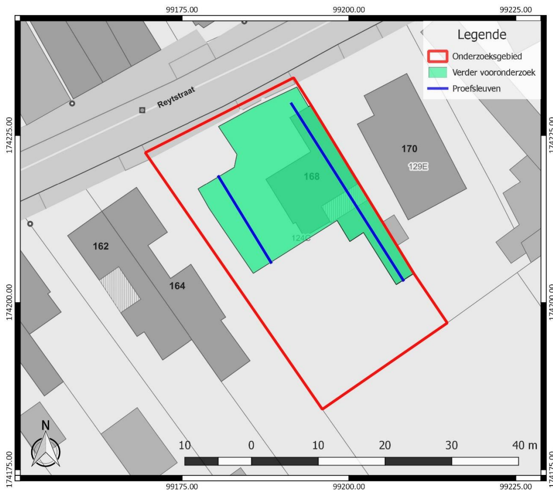
Figuur 4: Inplanting van de proefsleuven (blauw), binnen het onderzoeksgebied (rood), weergegeven op het GRB ( www.geopunt.be )

De proefsleuven hebben een maximale tussenafstand van middelpunt tot middelpunt van 15 m. De beoogde oppervlakte die onderzocht dient te worden door middel van proefsleuven, bedraagt minimaal 10 %. Dit wordt behaald aan de hand van het vooropgestelde sleuvenplan, dat voorziet in 46 lopende m proefsleuven.