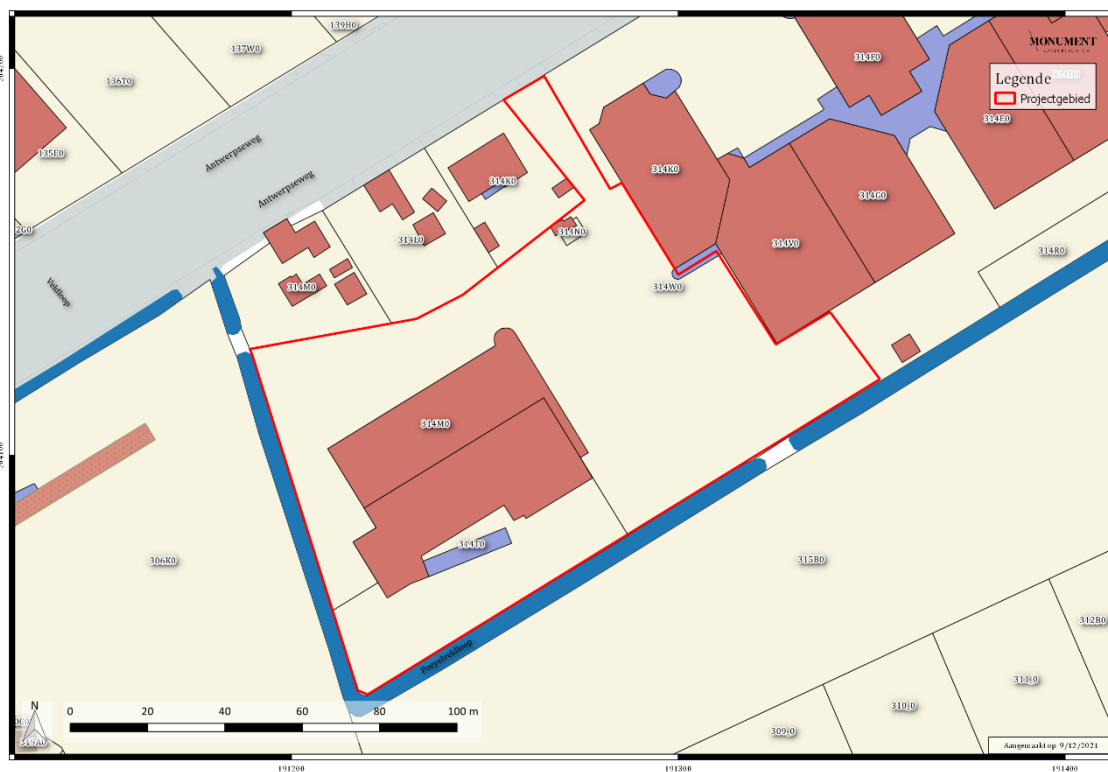
Figuur 1: Situering van het projectgebied op de GRB – Kadasterkaart – Bijlage 001.

Het vooronderzoek met ingreep in de bodem trof geen archeologische sporen of vondsten aan. Bijgevolg wordt de vrijgave van het projectgebied geadviseerd.