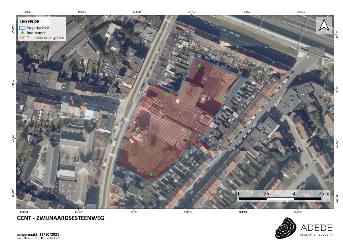
Figuur 1. Boorplan

Indien een verstoring van het (de) archeologische niveau(s) wordt vastgesteld, dienen bijkomende boringen geplaatst te worden om de verstoorte zone af te bakenen.