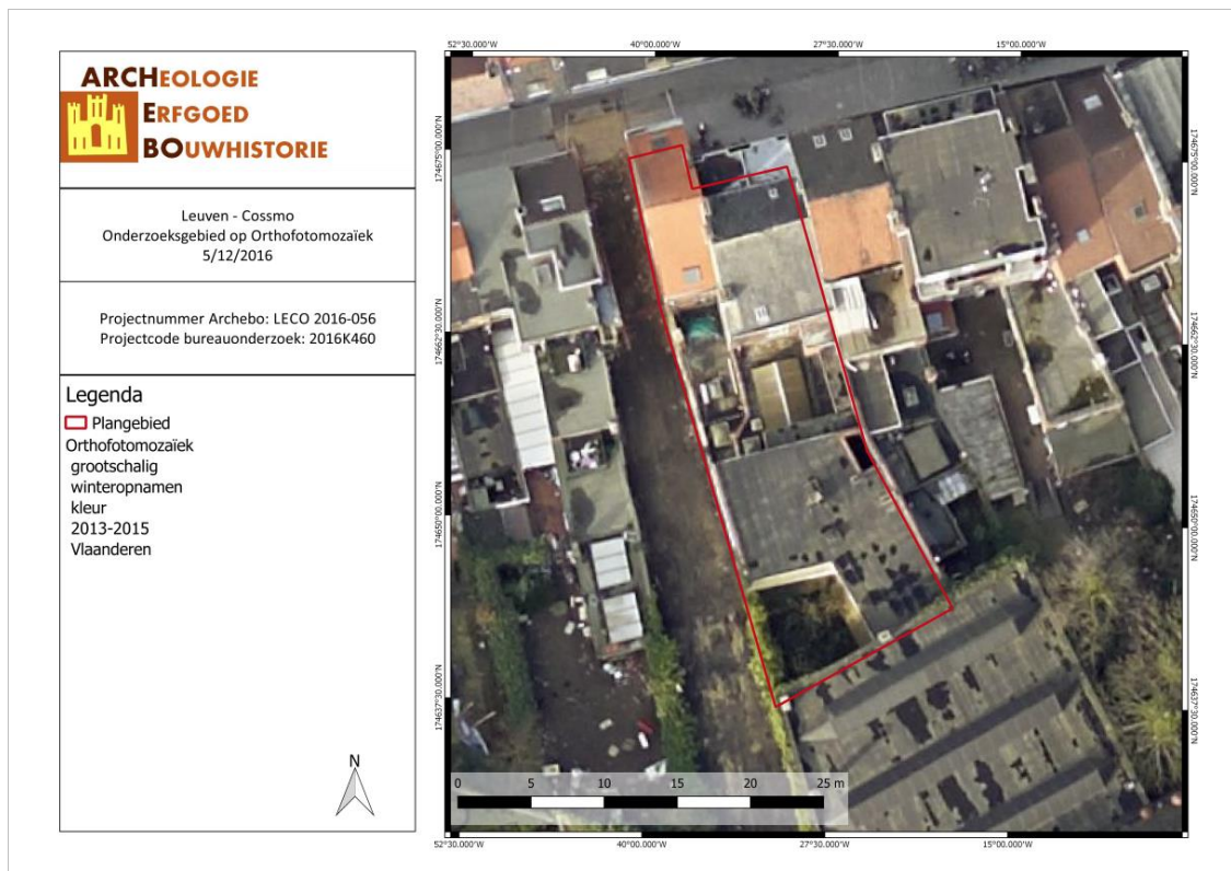
Figuur 2: Situering van het onderzoeksgebied op de Orthofotomosaïek (Geopunt, 2017).

De gelijkvloerse verdieping heeft een ingang langs links voor de toegang naar de bovengelegen woningen. In het handelspand wordt in de toekomst een winkel voorzien. Deze verdieping wordt uitgebreid met ca. 50 m 2 waardoor de groene zone in de zuidwestelijke hoek verdwijnt en plaats maakt voor bebouwing. Deze bijkomende bebouwing krijgt een plat dak met in het midden een lichtstraat van 150 op 50 meter. De eerste verdieping zal onderverdeeld worden in drie studio's en twee appartementen. De studio's komen aan de straatkant in de originele gebouwen terwijl de appartementen achteraan het perceel in de bijbouw komen. Origineel was er sprake van één appartement. Deze bijbouw gaat maar tot één verdieping. Vanaf verdieping twee komen de studio's enkel voor in de originele bebouwing van zowel huisnummers 220 als 222. Enkel de vierde verdieping (zolder/duplex) blijft onveranderd.