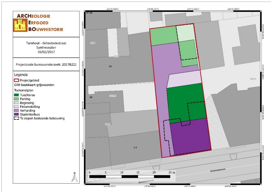
Figuur 4: Syntheseplan project Grimstedestraat (Geopunt 2017)