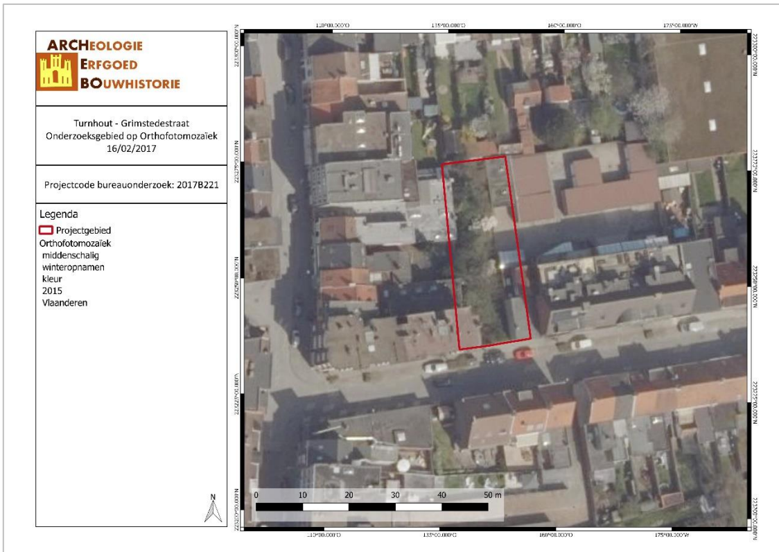
Figuur 3: Kaart met situering van het onderzoeksgebied op de Orthofoto, middenschalige winteropnamen, 2013-2015, Vlaanderen (Geopunt, 2017)