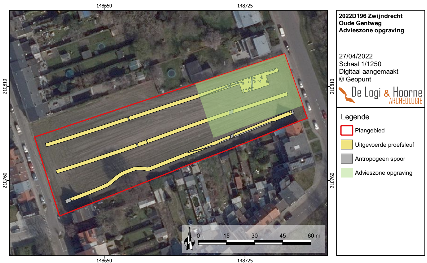
Figuur 53: Aanduiding van de advieszone voor vlakdekkende opgraving op een recente orthofoto uit 2021