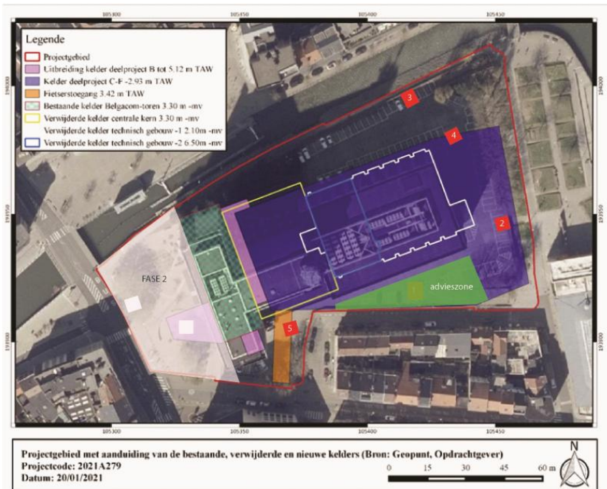
Figuur 2 GRB-kaart met aanduiding van de advieszone en de zone voor het proefputtenonderzoek fase 2.

De advieszone wordt opgegraven tot op de onaangeroerde grond.