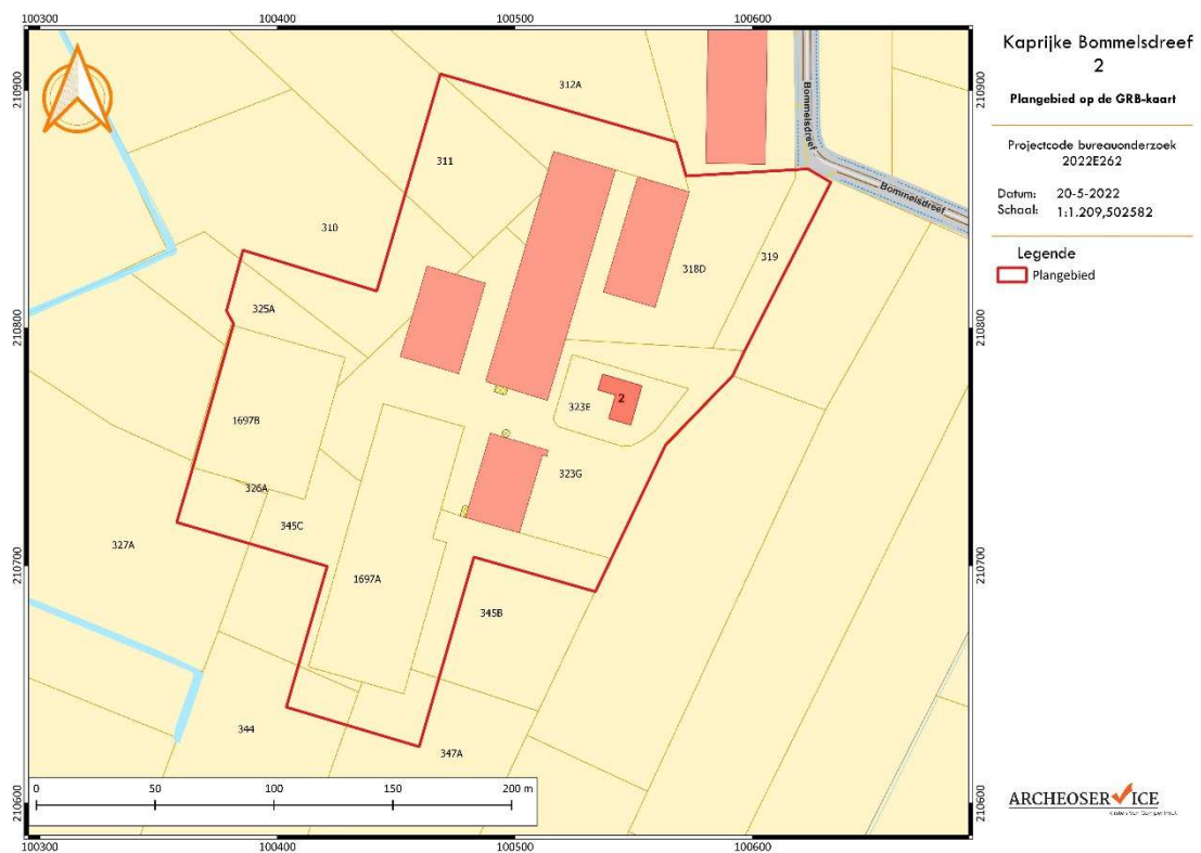
Figuur 2: Projectie van het plangebied op het kadasterplan.