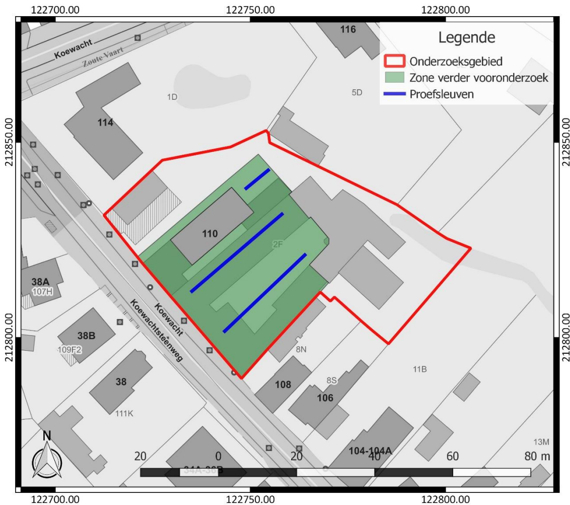
Figuur 4: Inplanting van de proefsleuven (blauw), binnen het onderzoeksgebied (rood), weergegeven op het GRB (www.geopunt.be)

De proefsleuven hebben een maximale tussenafstand van middelpunt tot middelpunt van 15 m. De beoogde oppervlakte die onderzocht dient te worden door middel van proefsleuven, bedraagt minimaal 10 %. Dit wordt behaald aan de hand van het vooropgestelde sleuvenplan, dat voorziet in 65 lopende m proefsleuven.