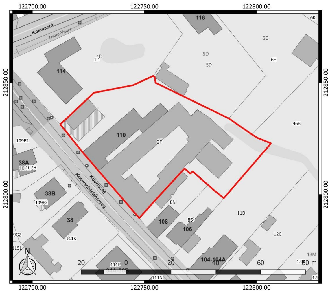
Figuur 1: Kadasterplan met aanduiding van het onderzoeksgebied in rood ( www.geopunt.be )