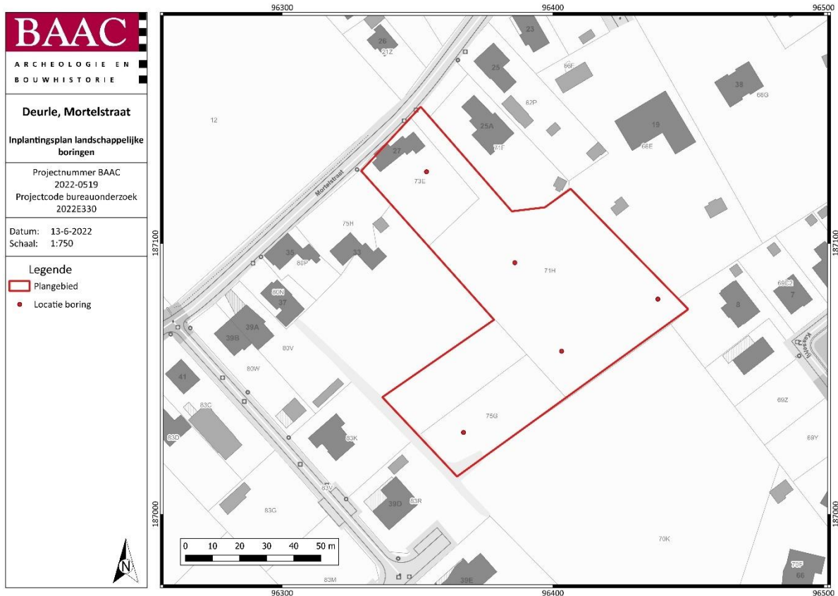
Plan 2: Inplantingsplan landschappelijke boringen (digitaal; 1:1; 13.06.2022)

processen, chemische processen, mineralogische processen en bodemhorizonten worden gedetermineerd en beschreven. De beschrijving van de boringen gebeurt conform de FAO guidelines for soil description en de Code van Goede Praktijk.