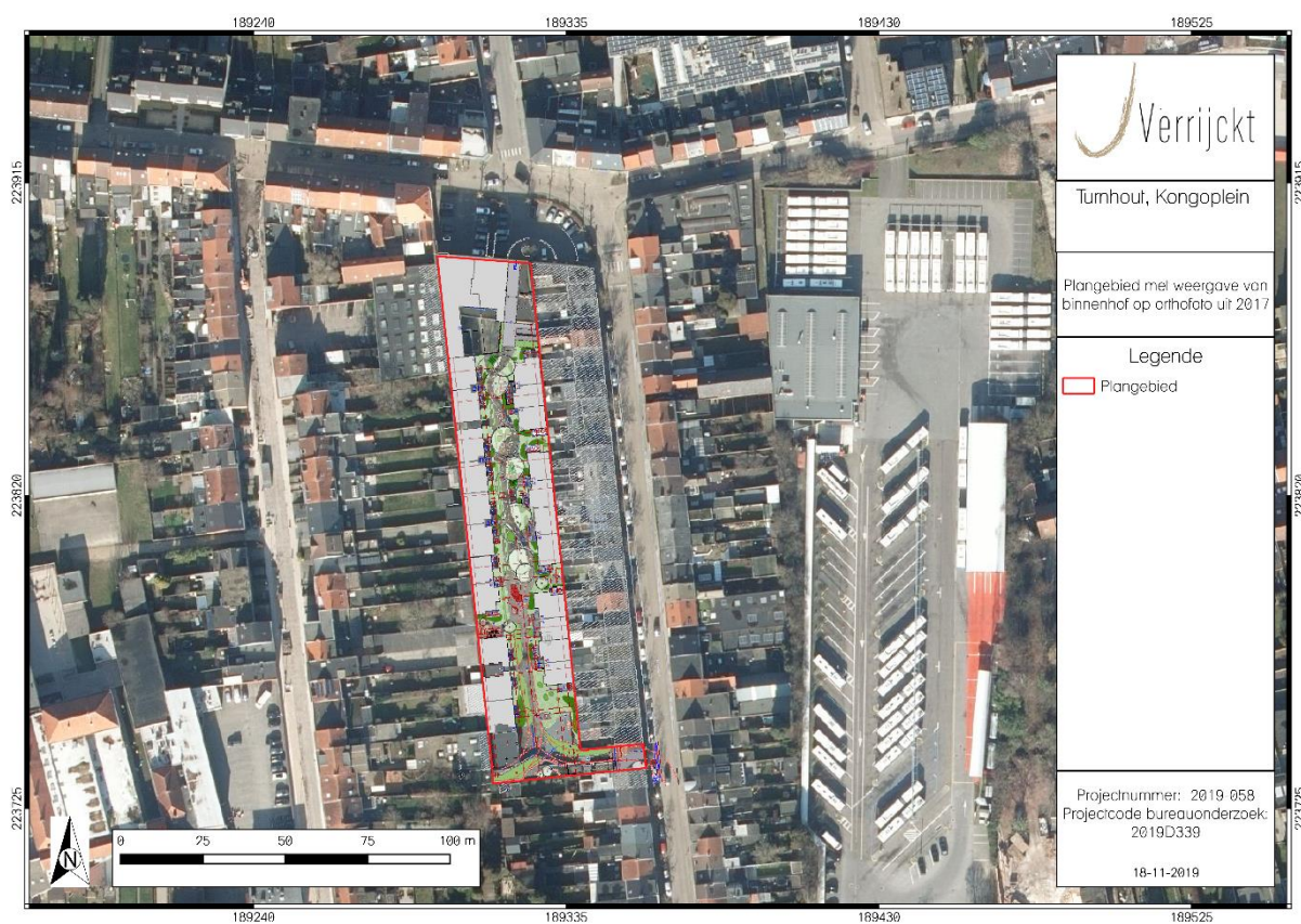
Figuur 1: Plangebied met weergave van toekomstige inplanting 1 op orthofoto uit 2017 2

De aanleiding van het vooronderzoek met ingreep in de bodem kadert in de uitvoering van het programma van maatregelen zoals opgemaakt in de archeologienota met ID 13139 en projectcode 2019D339. Deze archeologienota werd opgemaakt naar aanleiding van een renovatie van twee gebouwen en de bouw van enkele nieuwe gebouwen met bovengrondse en ondergrondse infrastructuur aan de Kongoplein in Turnhout. Meer informatie over de aanleiding van het vooronderzoek is terug te vinden in het verslag van resultaten.