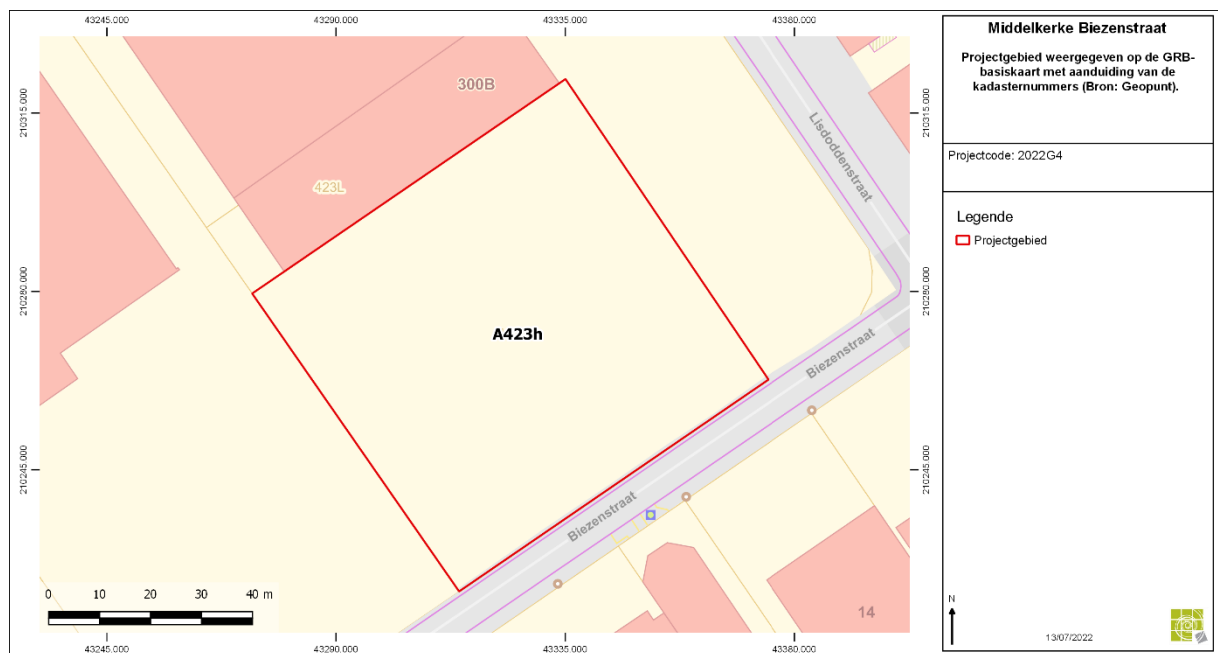
Figuur 1: Projectgebied weergegeven op de GRB-basiskaart met aanduiding van de kadasternummers.