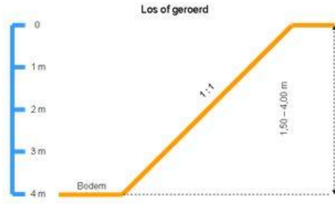
Figuur 2: Veiligheidsvoorschriften werken in talud voor sleuven uitgevoerd in losse grond

verwijderde verhardingen. Nadien worden de proefsleuven verdiept centraal in de sleuf en dit over de volledige lengte. Hierbij dient aan beide zijden een trap met een breedte van 1 meter te worden voorzien. Het centrale te verdiepen deel van de sleuf heeft met andere woorden een breedte van 2 meter, een lengte van 10 meter en een diepte van maximaal 2,40 meter ten opzichte van de onderzijde van de verwijderde verhardingen.