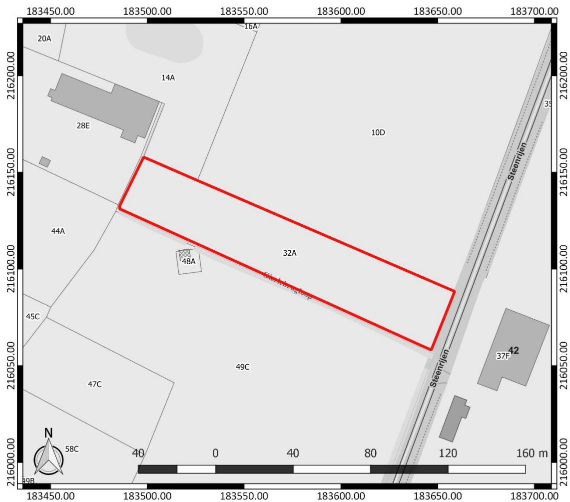
Figuur 1: Kadasterplan met aanduiding van het onderzoeksgebied in rood ( www.geopunt.be )