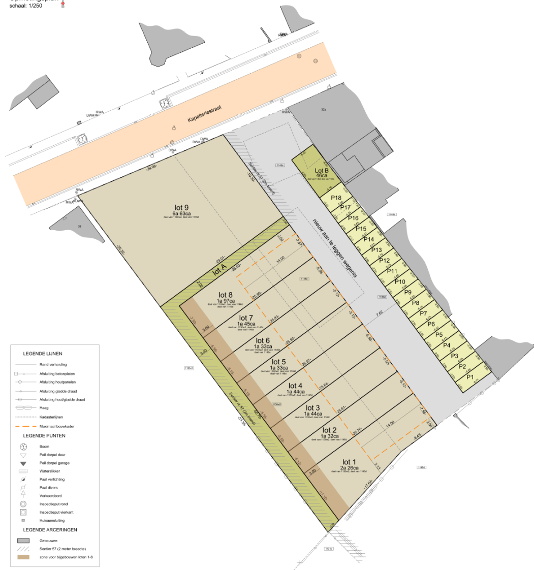
Afb. 3. Verkavelingsplan.